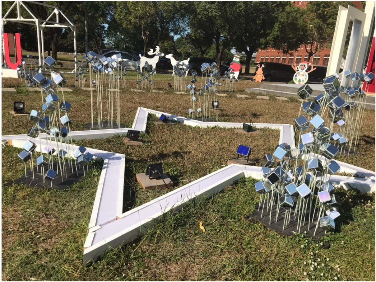
星行裝置及立方體反光柱體裝置