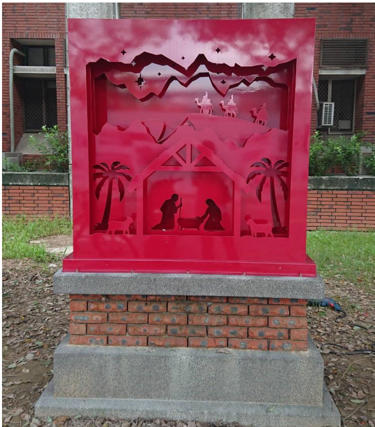
鋼雕設計品安裝於底座上