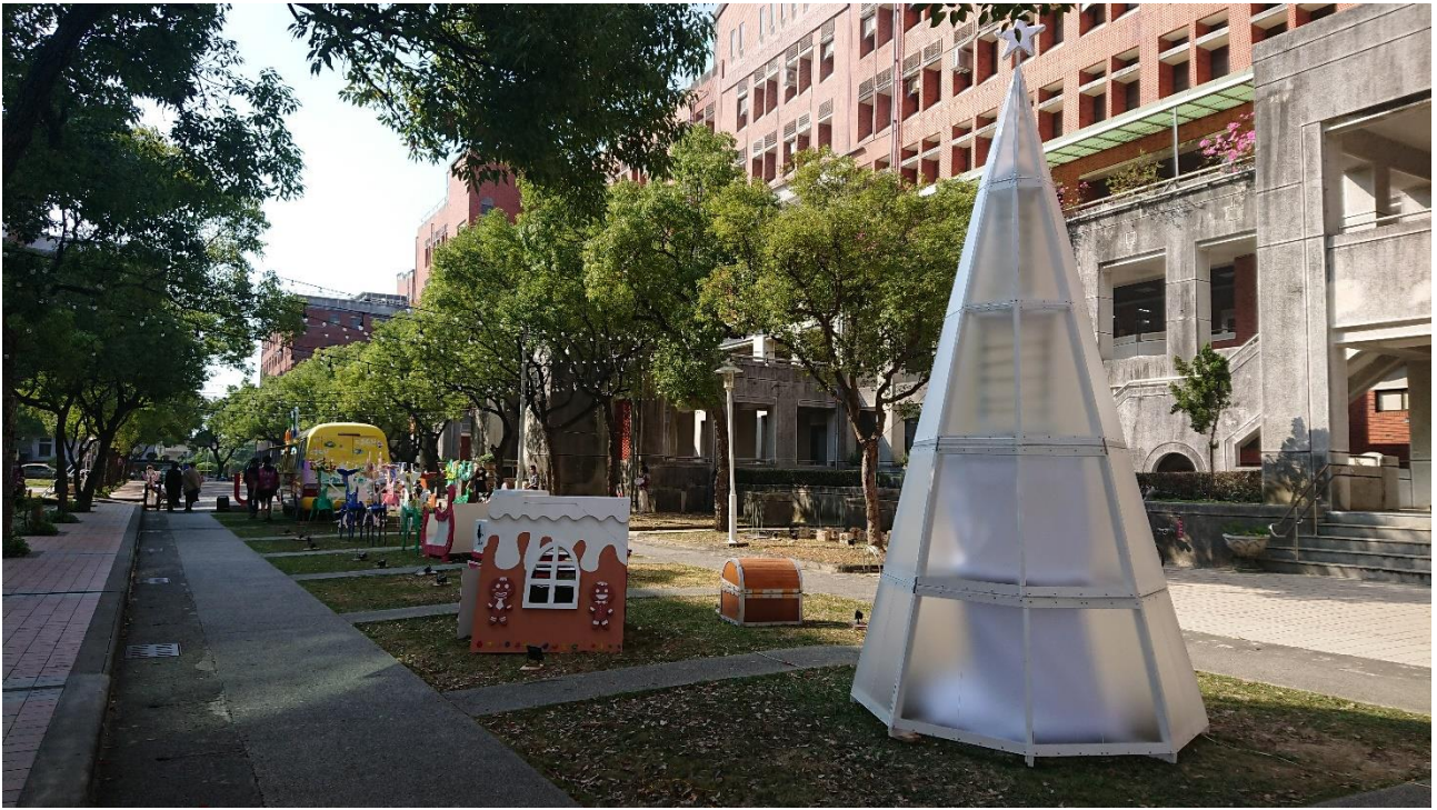
聖誕園區白天景象