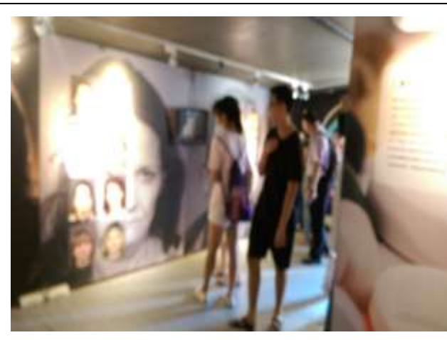
10/13 藥不藥、一念間反毒行動博物館參訪