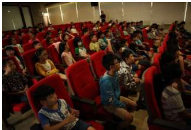
10/03 紅瓦厝國小反毒宣導-學生專心聽講