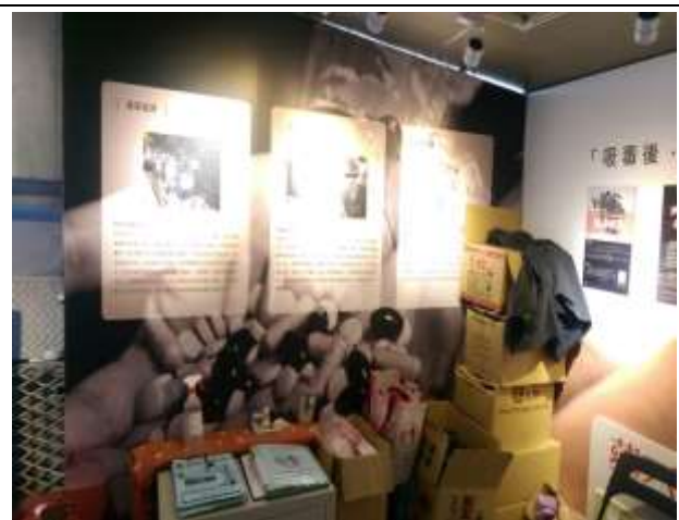
10/13 藥不藥、一念間反毒行動博物館參訪