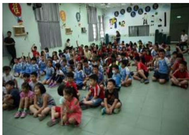
10/02 大潭國小反毒宣導-有獎徵答