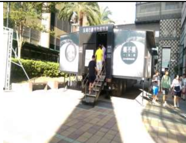
10/13 藥不藥、一念間反毒行動博物館參訪