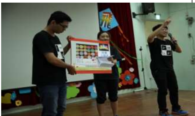
10/02 大潭國小反毒宣導-講解毒品種類