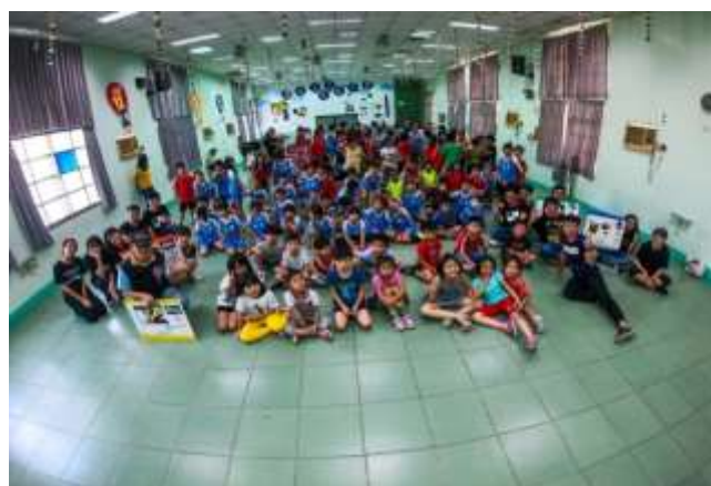
10/02 大潭國小反毒宣導-學生合照