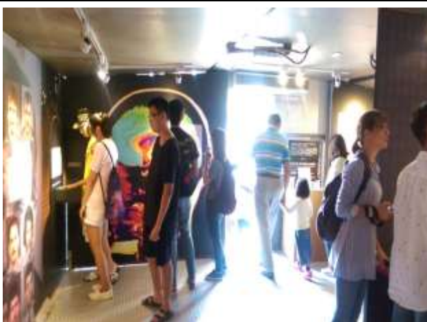
10/13 藥不藥、一念間反毒行動博物館參訪