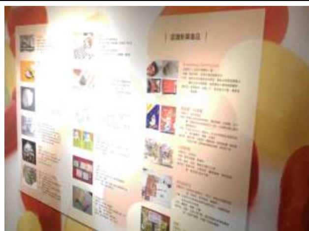
10/13 藥不藥、一念間反毒行動博物館參訪