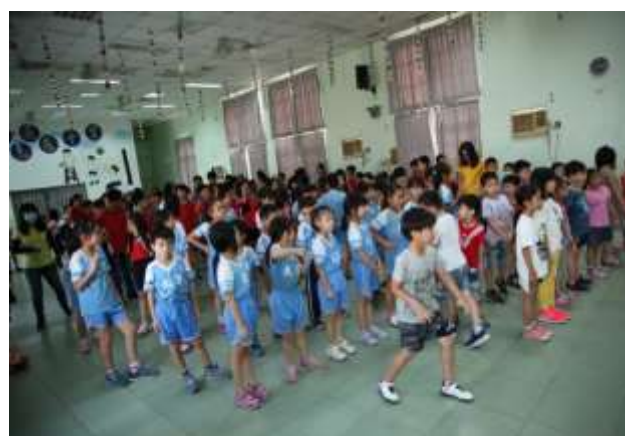
10/02 大潭國小反毒宣導-帶動唱跳