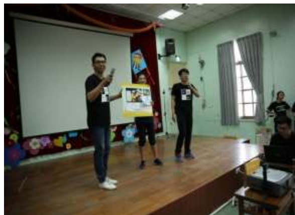
10/02 大潭國小反毒宣導-有獎徵答