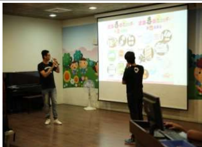
10/03 紅瓦厝國小反毒宣導-講解毒品種類