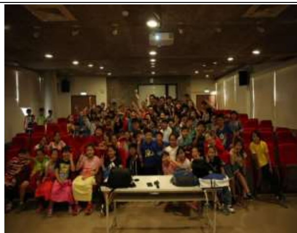
10/03 紅瓦厝國小反毒宣導-學生合照