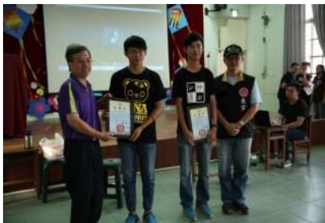
10/02 大潭國小反毒宣導-頒發感謝狀