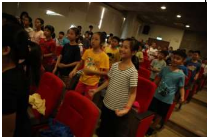
10/03 紅瓦厝國小反毒宣導-帶動唱跳