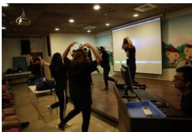
10/03 紅瓦厝國小反毒宣導-帶動唱跳