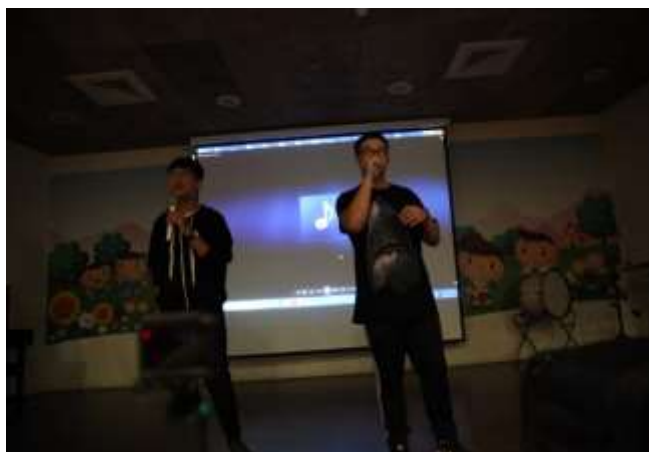
10/03 紅瓦厝國小反毒宣導-講解毒品種類