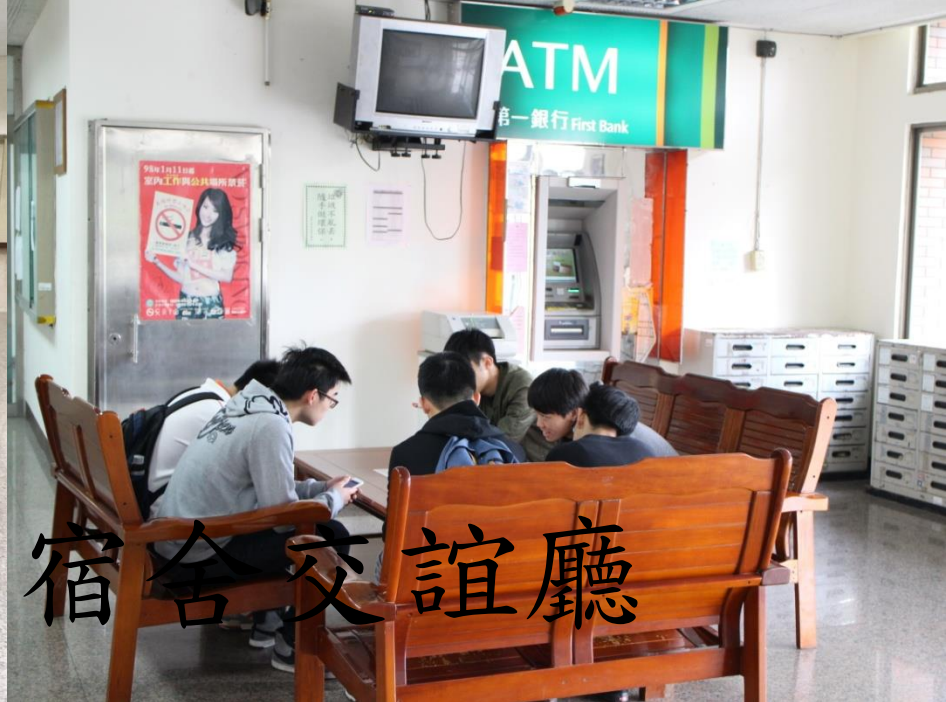
一、三、四宿合交誼廳