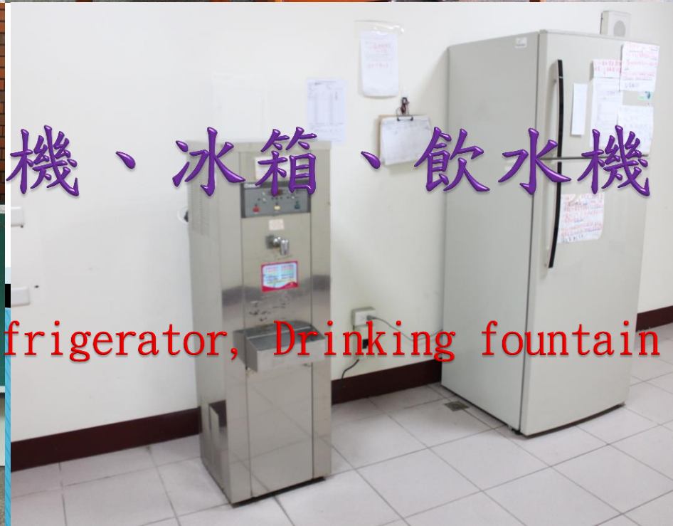
Lounge, Vending machine, Refrigerator, Drinking fountain