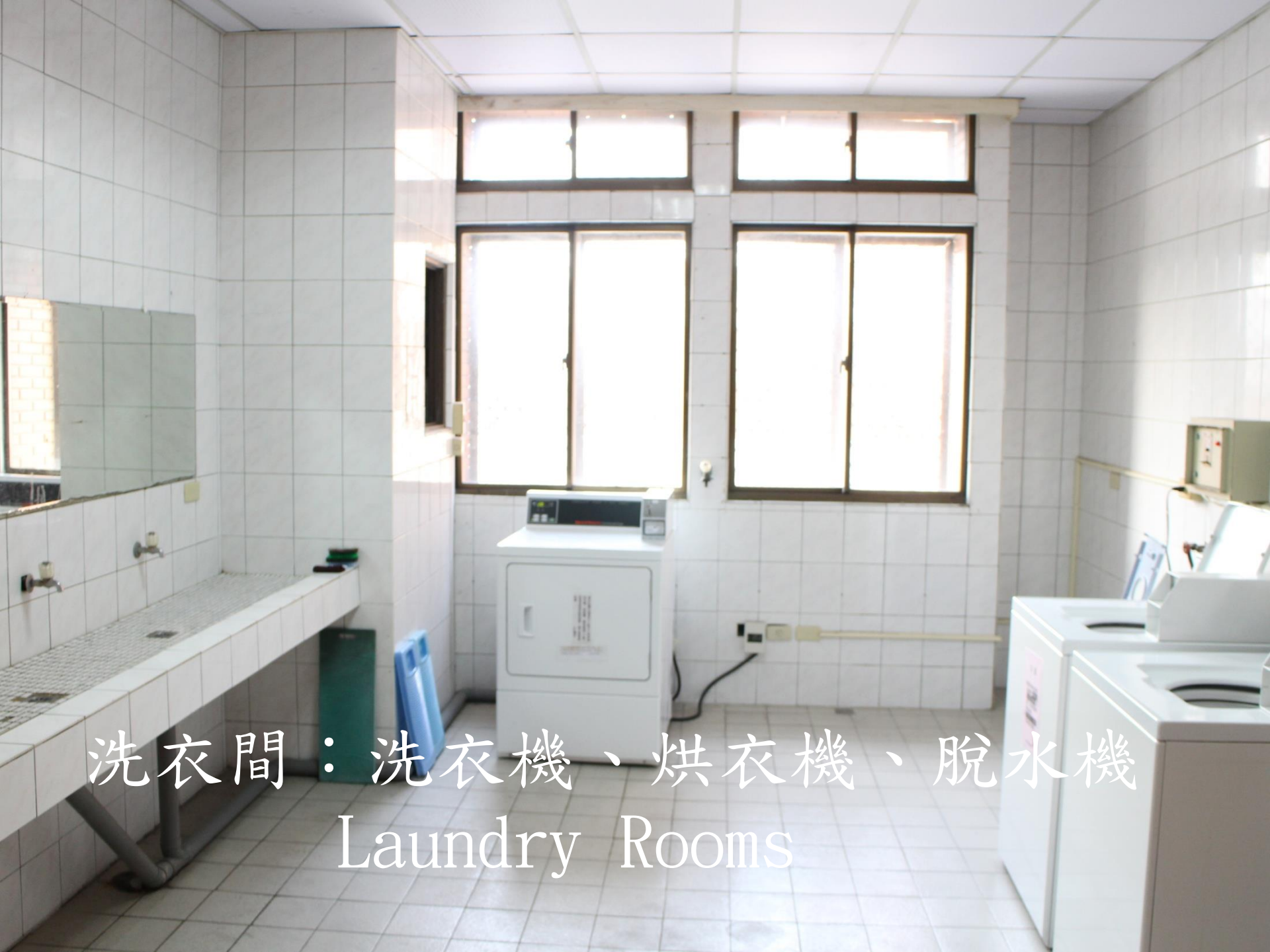
洗衣間：洗衣機、烘衣機、脫水機 Laundry Rooms