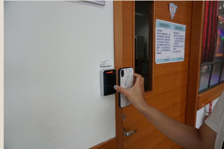
使用QR code 進入空間