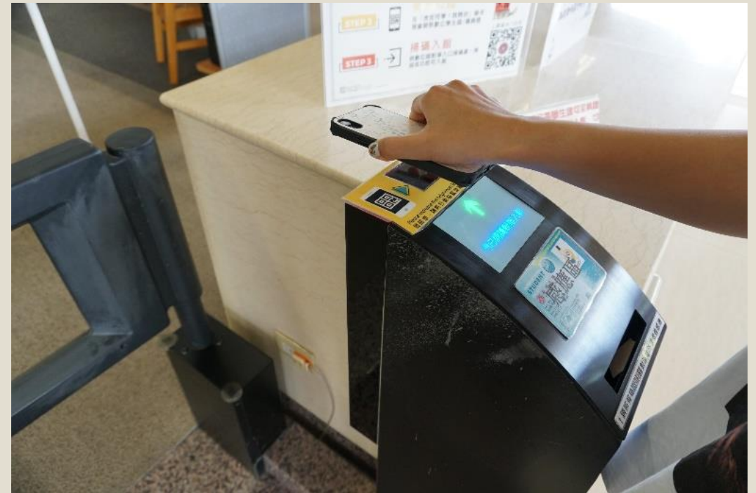
數位學生證入館 (虎皮)