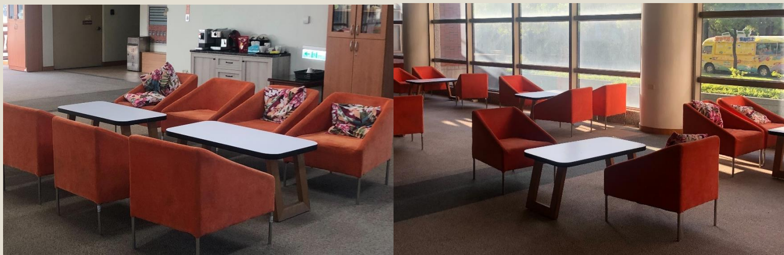
校友服務暨資源發展中心 ( 可自由交談討論 )