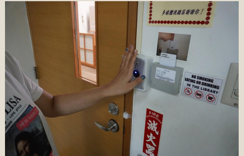
空間感應 開門離開