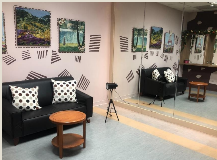
多功能討論室 1人以上