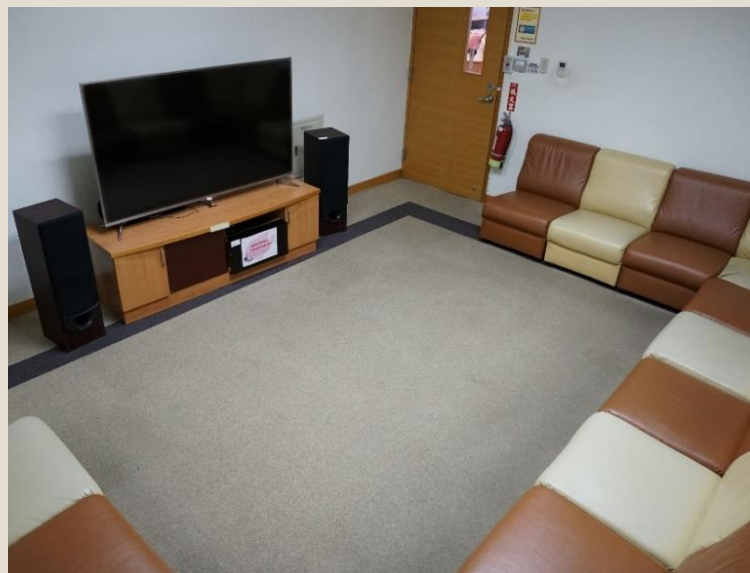
小團體視聽室 3人以上