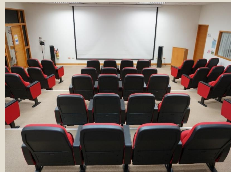
大團體視聽室 12人以上