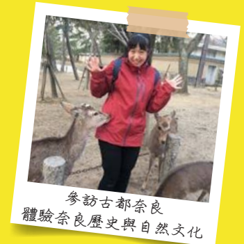
參訪古都奈良 體驗奈良歷史與自然文化