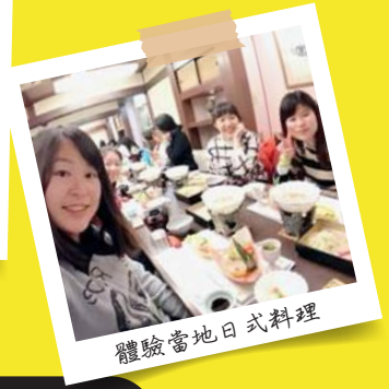
體驗當地日式料理