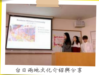
台日兩地文化介紹與分享