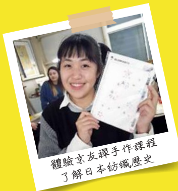
體驗京友禪手作課程 了解日本紡織歷史