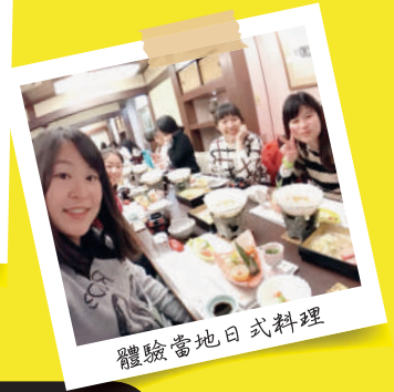
體驗當地日式料理