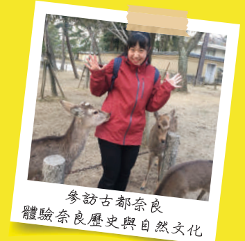
參訪古都奈良 體驗奈良歷史與自然文化