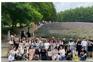
学外ツアー/Off Campus Bus Tour

Japanese Class, Japanese Cultural Event, Off Campus Bus Tour, etc.