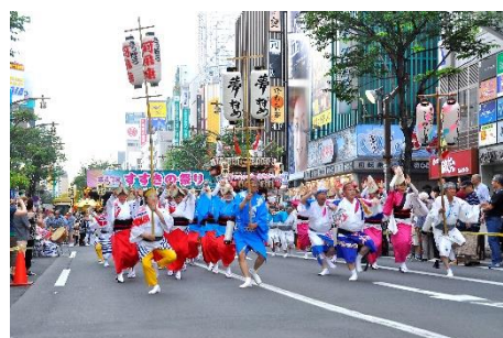
すすきの祭 Susukino Festival