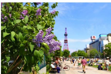
大通公園 Sapporo Odori Park