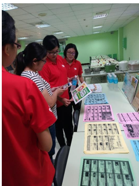
← 前往新營的一家企業擺攤