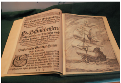
■《東印度旅遊見聞》一書日前在「臺灣學研究書展：海洋、殖民、近代化書展」展出。

Albrecht Herport, Reise nach Java, Formosa, Vorder-Indien und Ceylon, 1659-1668 , 赫伯特，《1659-1668年前赴爪哇、福爾摩沙、東南亞以及錫蘭的旅行記》一書，據鄭維中《製作福爾摩沙》（臺北：如果出版社，2006）一書所言，本書在1669年出版時的原標題很長，其中包括了「特別記載了大明人包圍並征服福爾摩沙的情況」，這也是這本書對臺灣地區的讀者彌足珍貴的地方。鄭維中給原書名的翻譯是——《東印度旅行短記》。至於 Reise nach Java, Formosa, Vorder-Indien und Ceylon, 1659-1668 ，這個標題，鄭維中說是復刊本所改的題目，他譯作《爪哇、福爾摩沙、印度和錫蘭旅行記》。