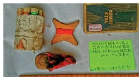
▲施喜縛腳繡花鞋、1920年繡花線裝放繡花線盒。