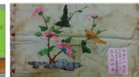
▲施喜作品1927年花鳥絲繡圖。