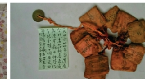
▲1946帶到台北鹿港寺廟平安符。