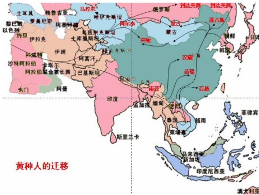
(一) 黃種人基因人類遷徙圖