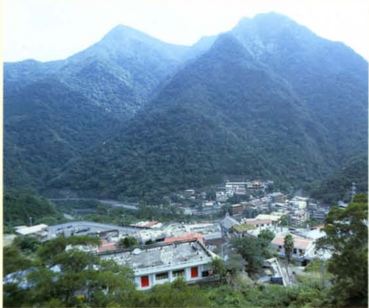
◆ 泰雅族烏來社現貌(上)，期待從新店溪三百五十年來的人河關係中，思考人水的倫理關係，為子孫保留一條清澈的溪流。