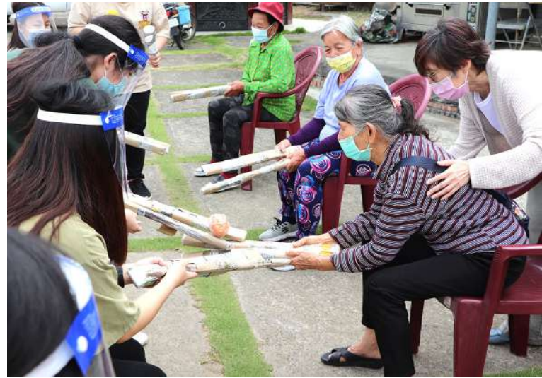
社工系自製活動道具訓練長者手部肌力

對我們的信任、鼓勵與彼此間的接納，使得原本覺得自己沒辦法做到的長輩願意去嘗試，也讓願意接受挑戰的長輩更有成就感，讓他們覺得自己是可以做到這件事的，甚至是有能力做到很棒！那些情感與動力自然而然的在據點生活裡蔓延開來，健康老化也跟著悄悄到來」。