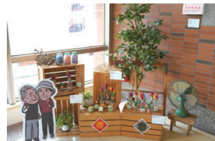
「伴·老·」高齡服務意象展，展覽長者的創意手作