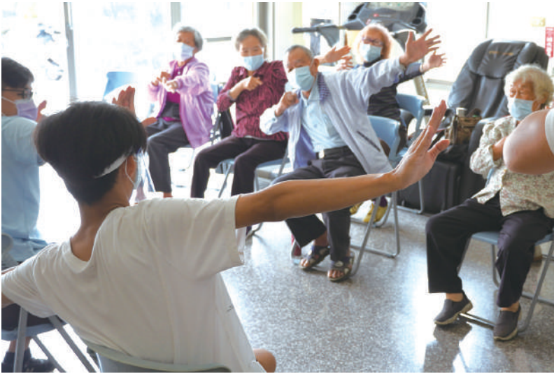
運技系示範並指導長者正確伸展動作