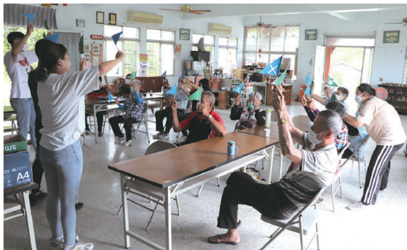
學生設計不同的前導活動，引導長者更快學會科技軟體

「長輩們拿著Switch搖桿化身法師互相比拼法力、開著礦車穿越礦坑隧道、揮著旗桿考驗記憶力，每位長輩都玩得不亦樂乎，驚呼連連大喊這耐ㄟ加趣咪！再來一次！」這是長輩與學生共遊科技輔具常見歡樂情境，儘管長輩仍會對於現代的科技感到陌生與害怕，但在學生們耐心的引導下，都變成了電動遊戲高手！