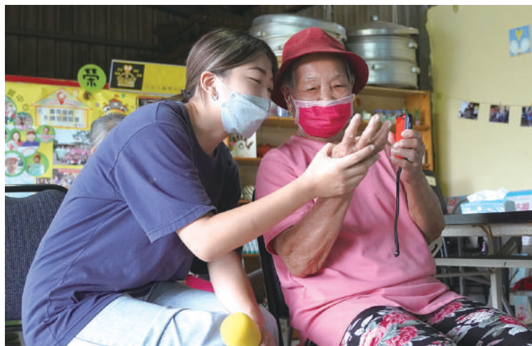
學生一步一步指導長者學習Switch搖桿