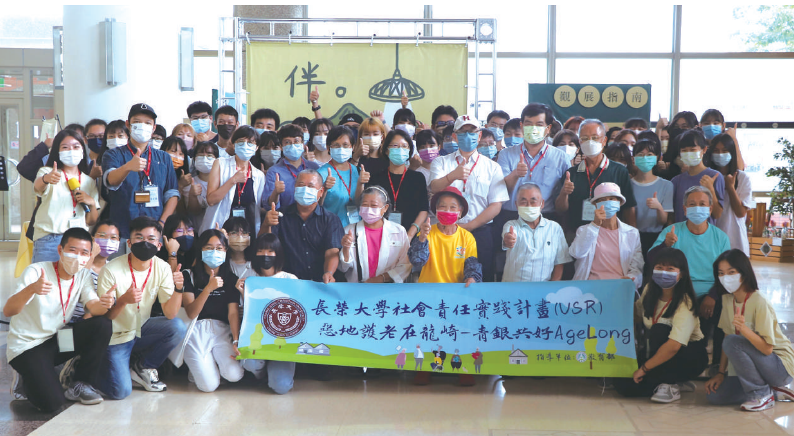
「伴·老·」高齡服務意象展開幕典禮