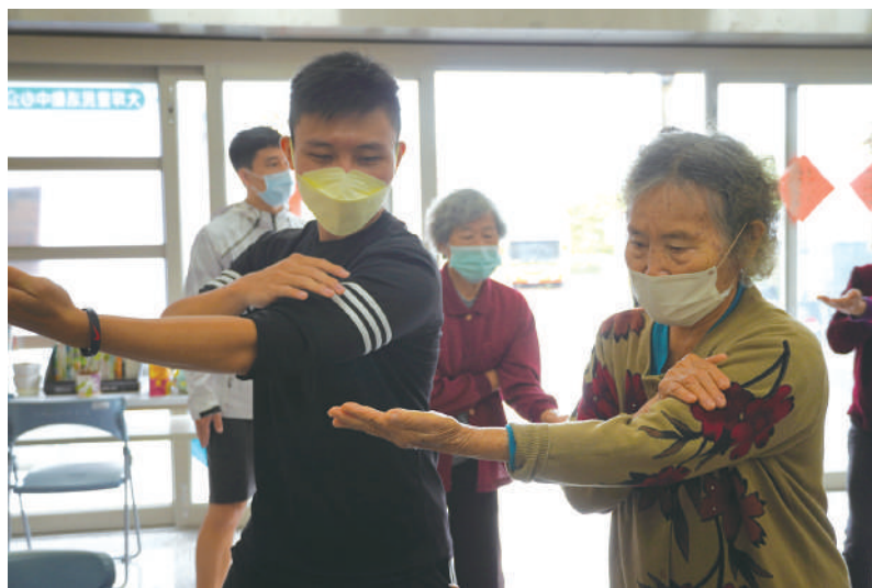
運技系示範並指導長者太極拳式

從計畫開展迄今，地廣人稀的龍崎高齡健康促進活動已從過去缺乏至今蓬勃發展成各里關懷據點皆有長期的穩定辦理。最初僅有龍崎永續發展協會、崎頂里辦公室、牛埔里辦公室開辦4個據點高齡健促活動，現今已增加龍崎衛生所、龍崎農會、台南市立醫院、一粒麥子基金會、萃文基金會以及計畫團隊深耕在地。