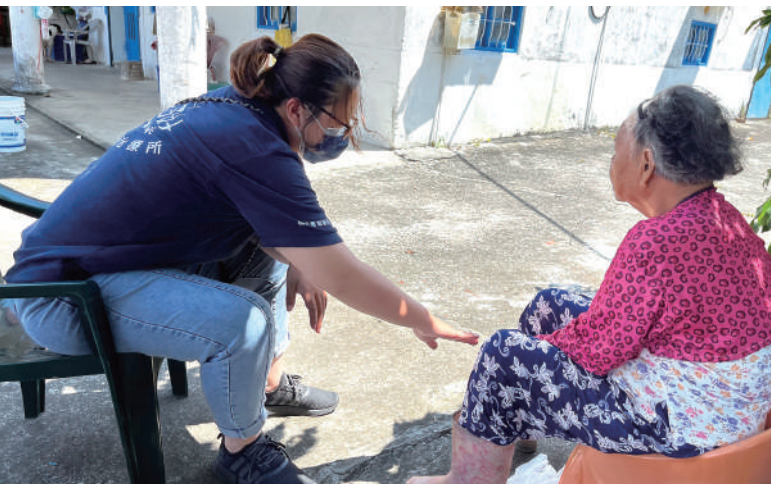
連結職能治療師評估居家環境及生活活動表現，設計復能處方

跨專業整合到宅個別服務藉由專業整合了解長者需求，並在陪伴的過程，觀察、傾聽、相互分享、貼近長輩的生活；看似計畫陪伴長者過程，學生也是與長輩學習，讓彼此的生活有更多不同的認識與發現，青銀共伴，這就是服務的意義。