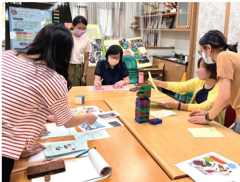
老師及學生討論教具修改方向

教材設計階段，整合護理、營養、職能治療、美術等不同專業，並以疊疊樂桌遊作為設計概念原型，期能透過寓教於樂的方式，讓長輩一邊玩、一邊能在這些簡單易懂的牌卡遊戲中，輕易學習預防慢性病、營養保健、預防跌倒等健康識能。