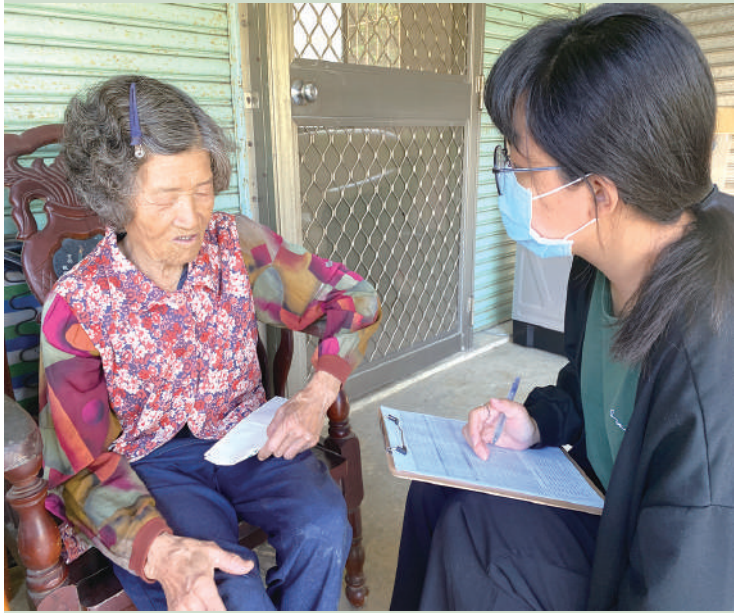
學生協助進行高齡者衰弱概況普查訪視