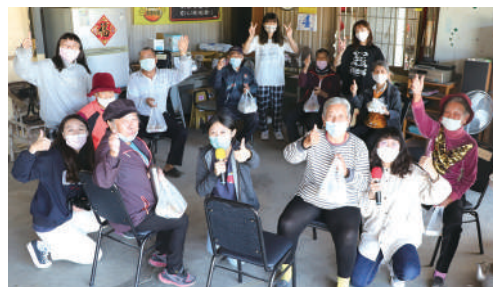
清泉據點活動結束合影