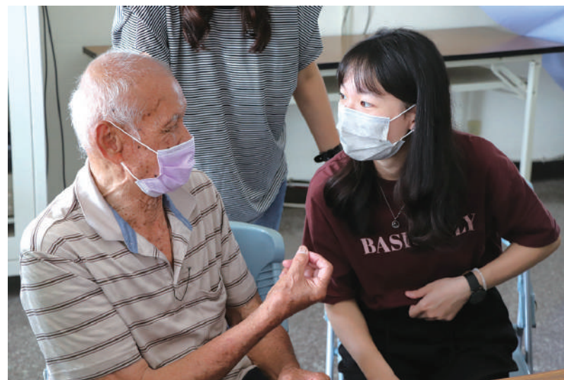
學生聆聽長者故事