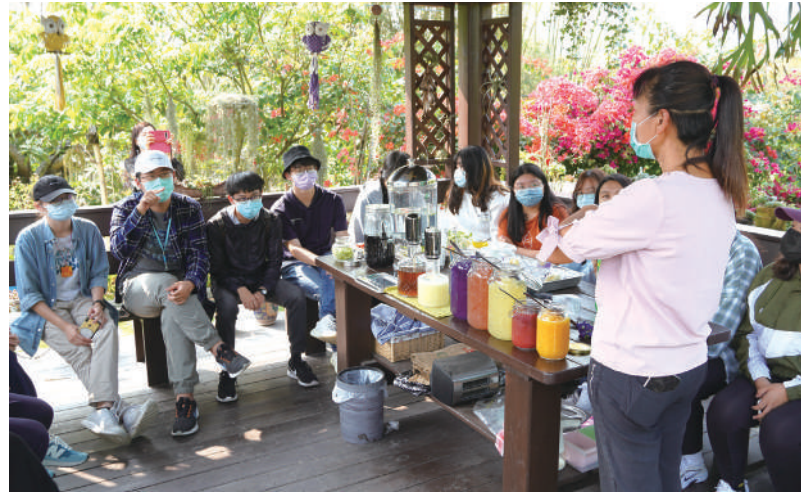
龍崎小農小燕子分享在地產業

近年來，龍崎在地組織開展了相當多的計畫致力於高齡服務，像是龍崎衛生所之衛生福利部國民健康署的「預防衰弱服務網-樞紐計畫」、龍崎區農會之行政院農委會「綠色照顧示範站」及臺南龍崎永續發展協會之行政院農委會水土保持局「農村社區綠色照顧計畫」等，整體龍崎高齡服務網絡逐漸綿密，對於龍崎高齡長者無疑是一大助益。