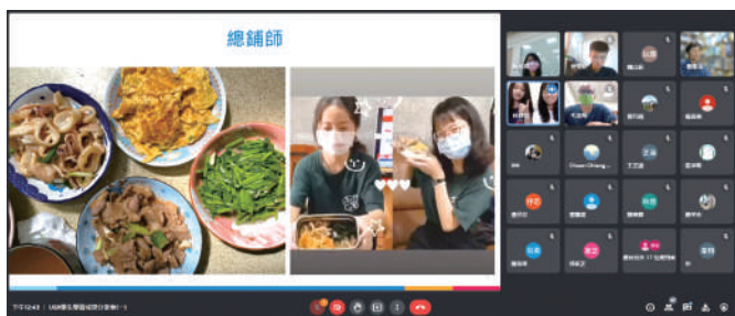
學生分享家訪的學習與成果