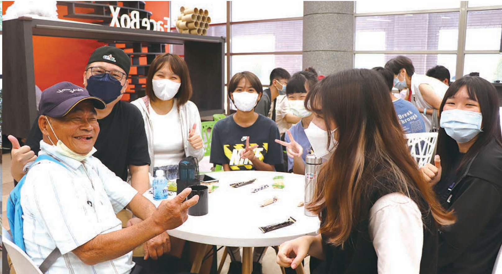
「伴·老·」高齡服務意象展