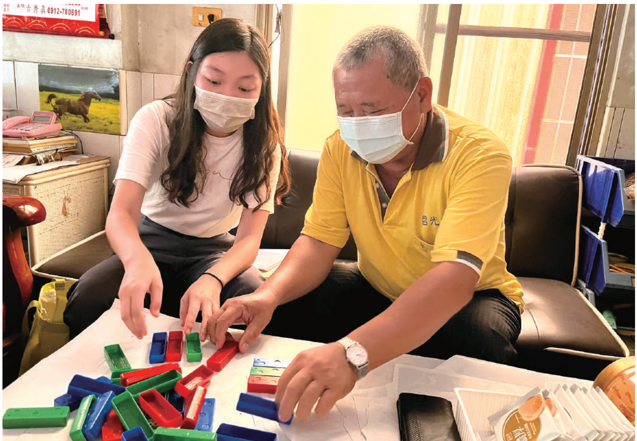
學生至長者家中試帶桌遊教具