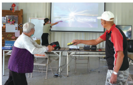
學生運用Switch帶領長輩健康促進