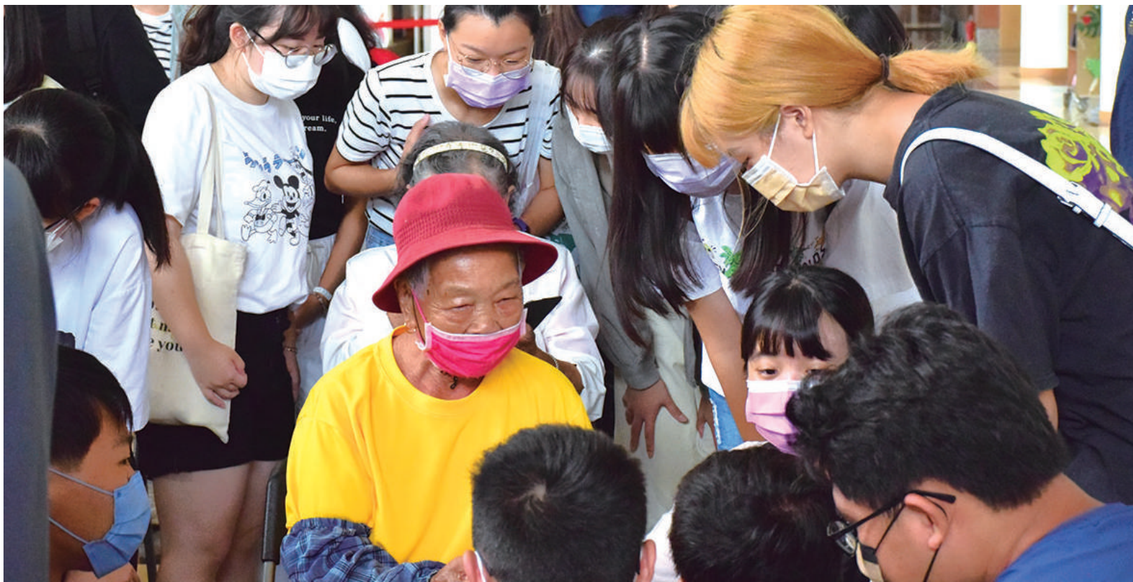
學生聆聽長者的生命智慧

晨光熹微，長輩們伴隨著鳥鳴，漫步至熟悉的清泉據點；學生們循著蜿蜒的路徑到山裡，用破台語帶著長輩們唱唱跳跳，據點重啟陪伴長輩已近兩年。