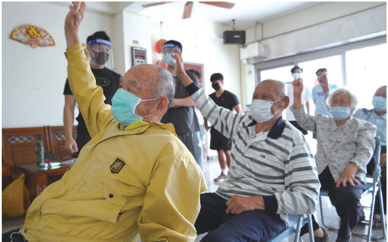
心理系進行認知活動