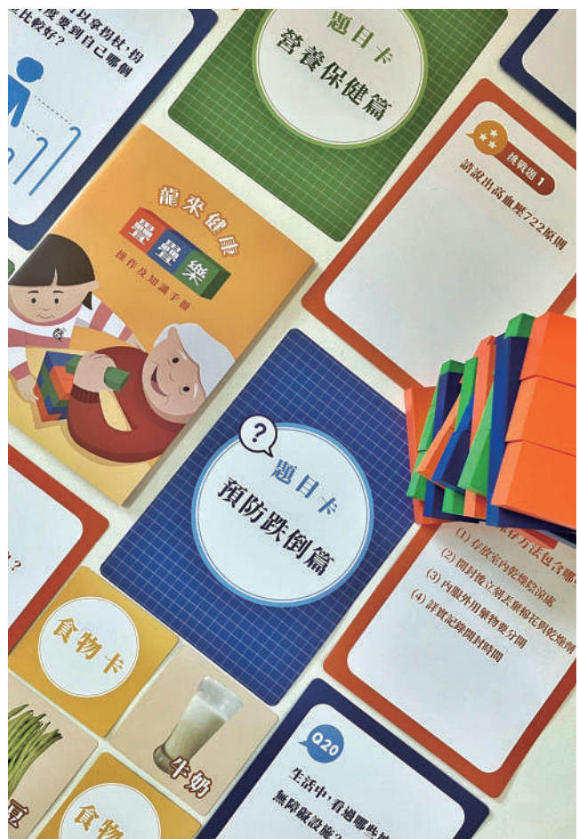
健康識能桌遊教具實拍

自2016年開始，《惡地護老在龍崎-青銀共好Age Long》計畫團隊進入龍崎區迄今已經五年，在這些年陪伴長輩的歷程中發現，許多老人家受限於識字能力欠佳或是訊息接收管道不足等，以至於健康識能較為缺乏。健康資訊的理解與運用是自我照顧的基石，高齡長輩的自我照顧能力則攸關其健康狀態，因此，如何依據龍崎高齡長輩的健康需求，設計出兼具知識性與趣味性的健康識能教材，便成為計畫的關注焦點。有鑑於主觀健康狀態有其社會文化差異，因此在進行健康識能教材設計之前，計畫先藉由在地老人關聯健康及自我照顧的口述敘事來澄清其自評健康狀態以及變化歷程，並根據分析結果釐清龍崎長輩最為重視的健康議題主要包括預防跌倒、慢性病預防管理以及營養保健等三項。而這樣的分析結果，跟龍崎衛生所行動醫院的健康篩檢，還有團隊過去進行個別家戶關懷訪視的觀察結果大致相符。