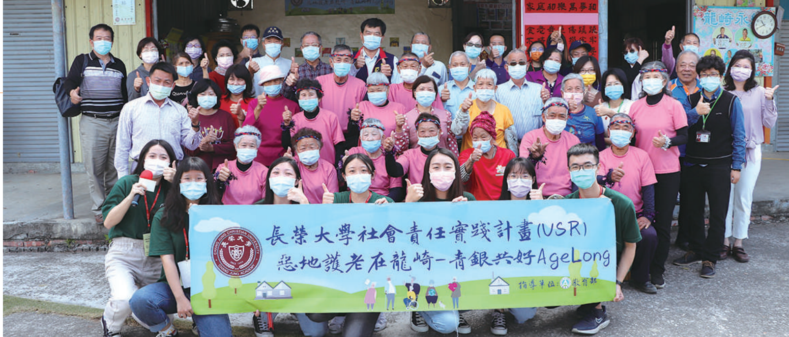
清泉據點揭牌開幕儀式