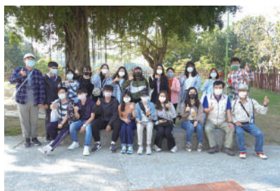
漫遊泥竹老島-龍崎人文走讀活動