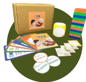
健康識能桌遊教具