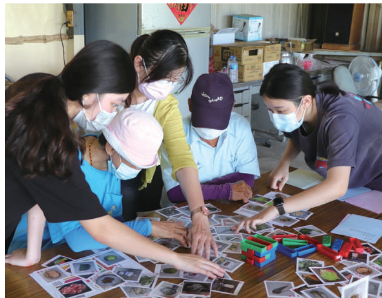
學生至據點試帶桌遊教具活動

尤其，跨領域合作一直是計畫的重點，藉著跟不同專業的互動學習，不僅學習到了跨專業的知識，更體認到「以長輩為中心」才是跨專業合作的核心，如何保持尊重與開放的態度，並接納不同角度的想法與建議，進而彼此溝通協商而非衝突與競逐，才是真正利於長輩的跨專業合作模式。