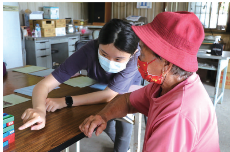
學生至據點試帶桌遊教具活動

長輩們自有一套生活哲學，也在歷程中不斷看見老人家的韌性，著實令人感佩！希望透過這樣跨專業團隊合作所創作的健康識能桌遊教材，能有效提升社區長者的健康識能，得以健康快樂的在地安老。