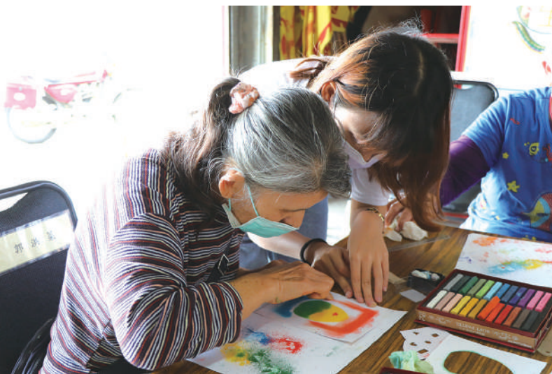
社工系陪伴長者用粉彩畫出復活節彩蛋