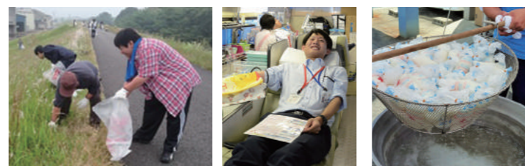
四国三郎吉野川沿岸の清掃 献血活動 炊き出し訓練