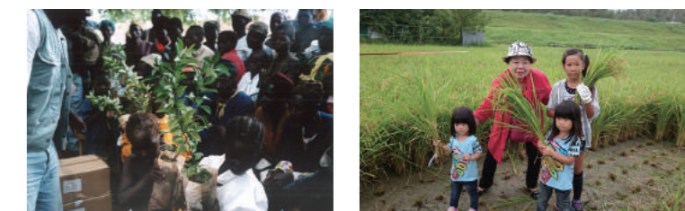
マザーランド・アカデミー支援事業

マザーランド・アカデミー・インターナショナルを通じて、国際協力田で育てたお米や衣類などを、毎年アフリカの国々へ支援物資として送っております。また、吉野川アドプト事業、献血活動を通じて地域とともに生きるボランティア活動を毎年継続して行っております