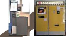
成績單立即取件： 使用一卡通、悠遊卡、Line pay 行政大樓一樓 小額繳款機： 使用現金 行政大樓1樓