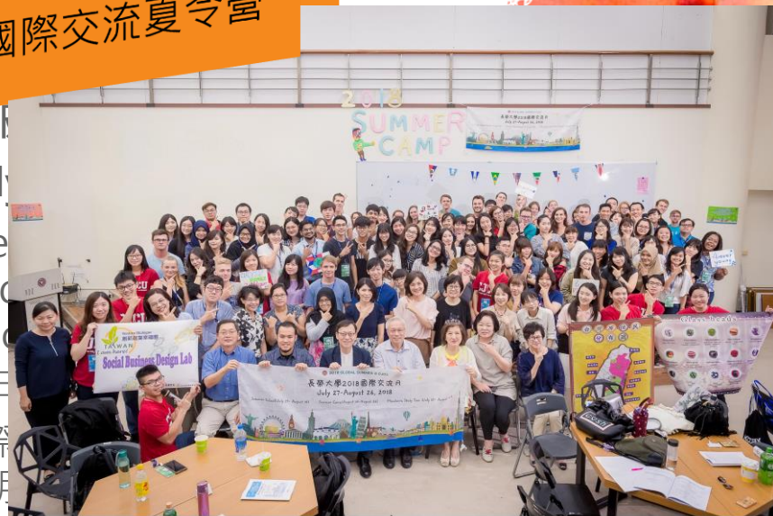
2018 Global Cultural Exchange Summer Camp