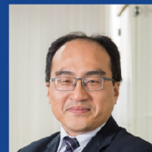
呂正華 數位發展部數位產業署 前署長