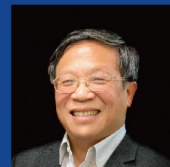
張慶瑞 國立臺灣大學物理學系 特聘教授