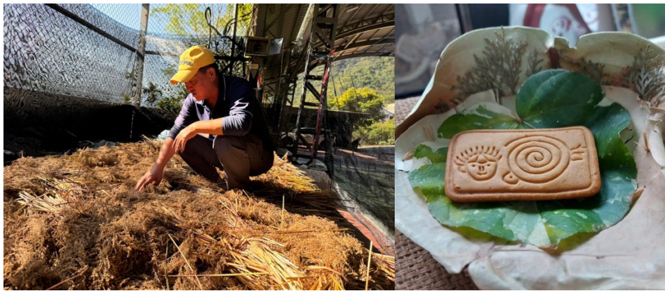
圖2、極抗旱未來食物-油芒