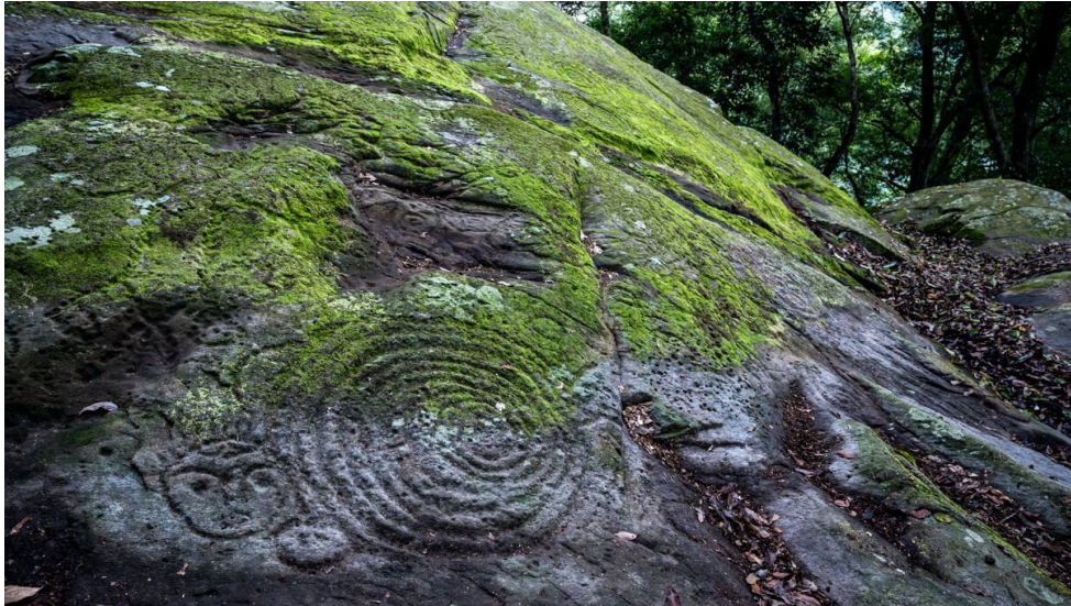
圖3、萬山國定岩雕遺址