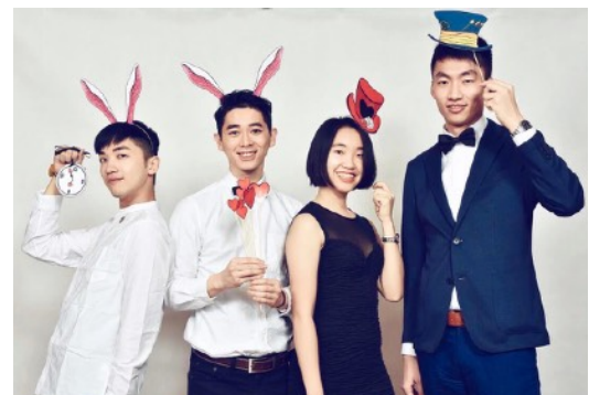
圖13. UHK Ball Student Gala night.