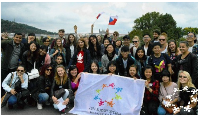
圖12. Trip to Prague with ESN.