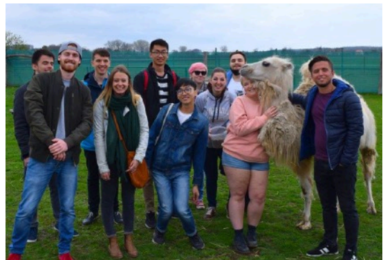
圖11. Zoo park.