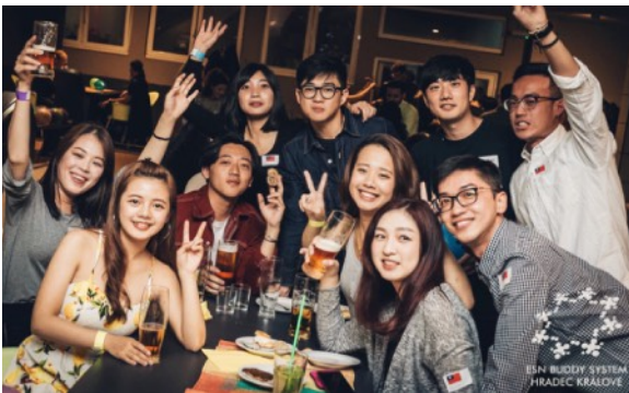
圖10. Welcome Party.

Buddy System與有些商家合作，國際學生持有ESN Card就能享有優惠折扣，是給予我們相當大的福利。他們也時常舉辦各種大小活動像是：Welcome Party, International Dinner, Country Presentations, Christmas Party, Zoo park等，而每週固定一天的晚上在Nox Club都是學生之夜，ESN會舉辦各種主題的派對。大活動則有：Trip to Prague, Trip to Krakow, Trip to Cesky Krumlov, Survival Weekend，ESN會帶領一群學生出去進行活動，特別是Survival Weekend，聽說是全捷克交換學生都可參加的，去過的人都覺得非常值得，認識很多新朋友。2月初的” UHK Student Ball Gala night” 是鎮上一年一度全校師生都會參與的最盛大舞會，今年主題是愛麗絲夢遊仙境，男生著西裝、女生晚禮服，同時也會加入主題元素，各個盛裝打扮展現最好的一面，舞會中除了邀請學生社團成果發表外，也會看到大家在舞池一同隨著音樂跳著華爾茲、探戈、恰恰等，那種大家同樂的感覺非常開心，也是特別的體驗。