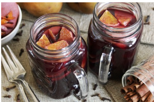
圖17. 熱紅酒。

外國人對於聖誕節的重視，之於亞洲人的農曆新年；學生們在結束上學期所有課業後，便開始陸續返鄉過節了，歸心似箭的心情，對於我們這些漂泊異鄉的遊子是最能夠體會，和家人團聚是多麼的可貴難得。還好有位阿姨定居奧地利格拉茨，便邀請我及朋友們一同過節，大夥兒搭著火車從捷克南下，平安夜時阿姨準備了一桌家鄉菜、酸菜白肉鍋，那種在異鄉相互照顧，一起圍爐的心情是無法言喻的感動。