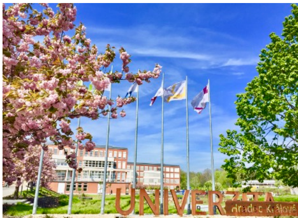
圖1. UHK 校園大門。

UHK教授與學生之間，互動輕鬆自然，教授也會因材施教、讓其適性發展，根據學生不了解的地方特別指導，主要是希望每位學生都能從學習中找到更多信心及動力；該校學生組織也常舉辦各種活動，促使在課業學習之外，也能從課外活動中讓學生找到其他樂趣。