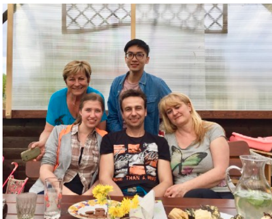
圖14. 捷克朋友家中聚會。

經由捷克朋友們的分享，我覺得不管大人或是小孩都非常喜歡親近大自然，他們會利用假期進行戶外活動，像是春天野餐露營、夏天爬山溯溪、秋天到森林採香菇、冬天滑雪，而不是整天關在家中面對電子產品，戶外活動帶來身心靈的釋放及舒壓，我認為是值得學習也有益於人們情感的交流。