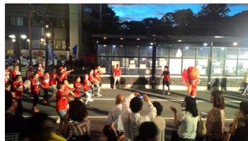
↑ 祭典時同事拍的照片、禮物；祭典