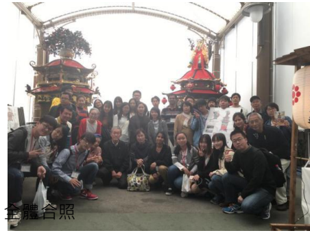
↑ 八代祭與接待家庭、全體合照