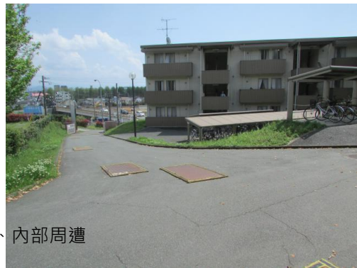
↑ 宿舍大門、內部周遭