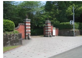
↑ 黒髪南区、百周年記念館、黒髪南区