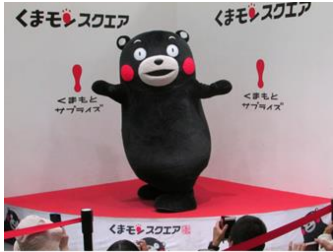
↑ 熊本熊部長辦公室、熊本熊

日常生活方面，我室友是兩位印尼人和一位中國人，平時溝通都是日英參半，其實面對國際宿舍的各國留學生，英文溝通能力也很重要，因為熊本大學的交換生並非全部都會說日語，有些國際生是以英語能力來做交換。平時在宿舍，好朋友之間都互相串門子，聚在一起吃飯辦小派對。住在國際交流宿舍最大的優勢就是可以結交各國朋友，互相聊天交流，分享各自國家的文化等等。