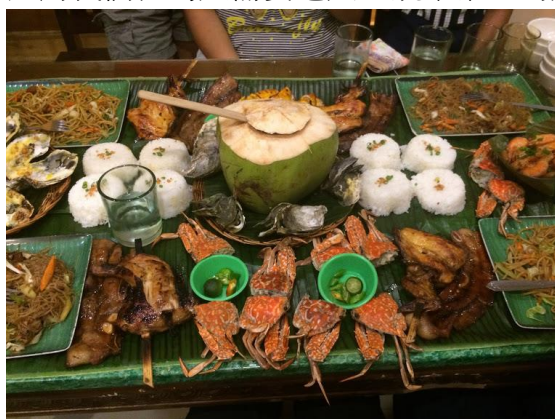
圖六：當地的手抓飯料理

在這裡的交通方式主要有 jeepney，tricycle 和計程車三種。jeepney 的費用相當便宜學生一個人只要 5 塊披索，tricycle 要看你要去哪的距離，上車前先跟司機談好價錢即可，而計程車跳表價是上車 40 披索也就是大概台幣 30 塊而已，這種物價在台灣根本是不可能。當地的飲食習慣我最無法接受的是他們通常是白飯加肉就是一餐，幾乎沒有蔬菜水果，甚至菜比肉貴，這對我們台灣人需要吃大量蔬菜維生的人來說根本難以接受，這是最難以適應的一個地方。