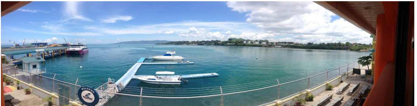
圖七：要往宿霧薄荷島的渡船

還有必要的費用是學校會幫我們申請 SSP(study special permit)這是要證明在這裡學生的身分，當你去辦延簽時移民局的人也會查驗你是否有申請，一次的費用是 5500 披索，半年申請一次所以待一年的話就是要申請兩次。至於延簽要自己去移民局辦理，第一次延簽還要包括辦理 I-card 類似像居留證，大約 8000 到 8500 披索，再來延簽的費用大約是 3000 到 4000 披索。