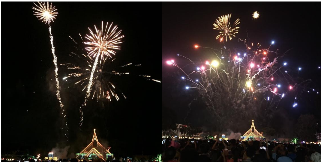
圖十一十二：聖誕節學校點燈

這段期間我所得到的經歷比我自己想像的還要多，學好英語很重要，會發現語言不通真的是寸步難行，規劃未來也很重要，但更重要的是活在當下。菲律賓人開朗看待簡簡單單的生活卻又如此滿足的人生，韓國人認真積極學習英文和中文的態度，這都是我值得學習的地方。我很慶幸我來了菲律賓，也很高興當初做了當交換生的決定，我相信這個決定將會改變我未來人生的部分選擇，經過這一年，我看了很多的風景，體驗很多以前不曾體驗過的，思維更加多元化了，也從中學習到了很多不一樣的東西，也認識了很多朋友，我開始相信人跟人之間有無限的可能，這段經歷會是我人生中難忘的一部分。