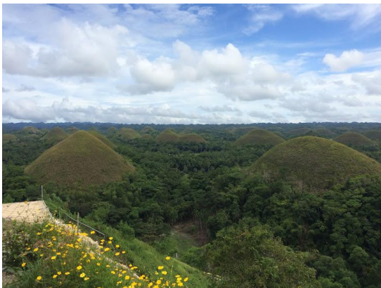
圖八：宿霧有名的巧克力山