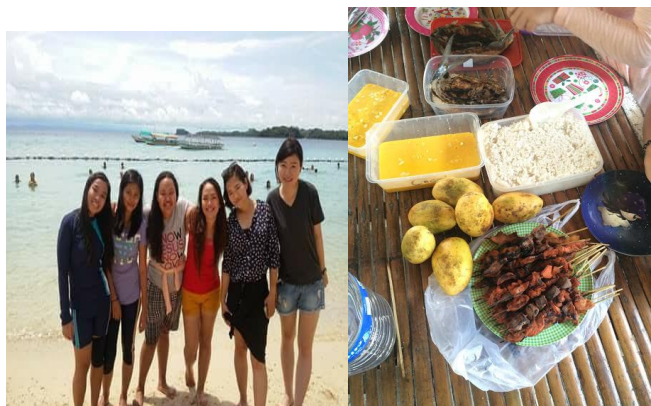
圖四圖五：和當地人出去玩及他們準備的食物

管是學校的行政人員所管理，他們一家人和我們住在一塊，時常聽到弟弟的吵鬧聲覺得格外溫馨。我們剛來到這裡的第一個禮拜，菲律賓當地人便帶我們去離學校最近的海邊玩，坐當地的交通工具 jeepney 再轉搭船前往特別有一番風味，第一個禮拜便體驗到到當地人的熱情與親切更是開心。