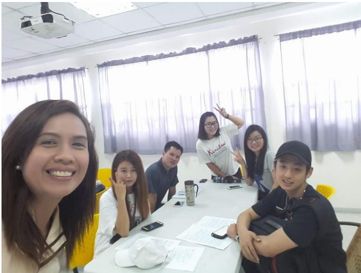
圖二：與韓國和越南同學一同小組討論

有時候老師上課會不自覺的講出菲律賓話來，或者是同學回答時會講菲律賓話，老師會馬上意識到，馬上親切說班上有來自台灣的同学請用英文解釋，這讓人感覺毫無距離感阿。這裡上課也常常隨機分組，老師會避免學生只跟同國家的同學或是跟你熟識的同學練習，時常要交換你的夥伴，一開始我有點緊張這樣的上課方式，但後來發現這樣更多了認識其他人的機會。