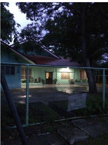
圖三：學校女生宿舍