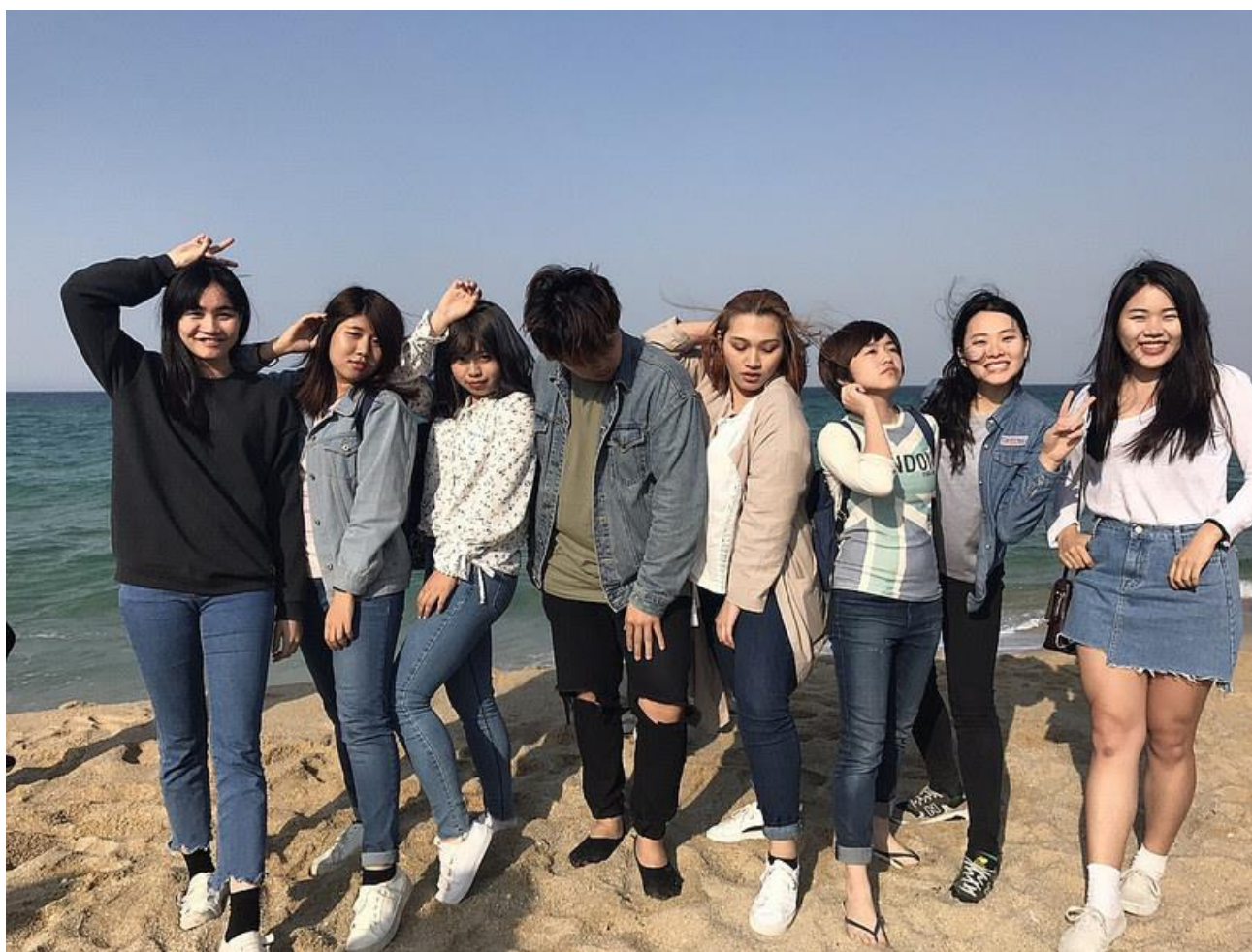
上圖為一起交換的台灣朋友們

很慶幸自己能完成這一趟交換生生活，在此趟交換生活裡，學習到很多曾沒接觸過的知識與文化，原本想著大四畢業後就要直接踏入職場生活，殊不知遇到此次的契機，讓我有機會前往韓國體驗不同的文化生活。開始準備面試以及書面資料的期間雖然忙到不可開交，但這些努力換來的就是前往韓國體驗交換生活，真的是一份很值得很珍貴的回憶。而我也非常樂意分享這些經驗給未來即將前往韓國的學弟妹們，這種傳承的精神，感覺真的很棒，也希望這份心得有幫到需要的學弟妹。在未來，如果還有機會能出國留學的話，我一定會再次把握機會前往，唯有自己體會過，才會知道它的美好。