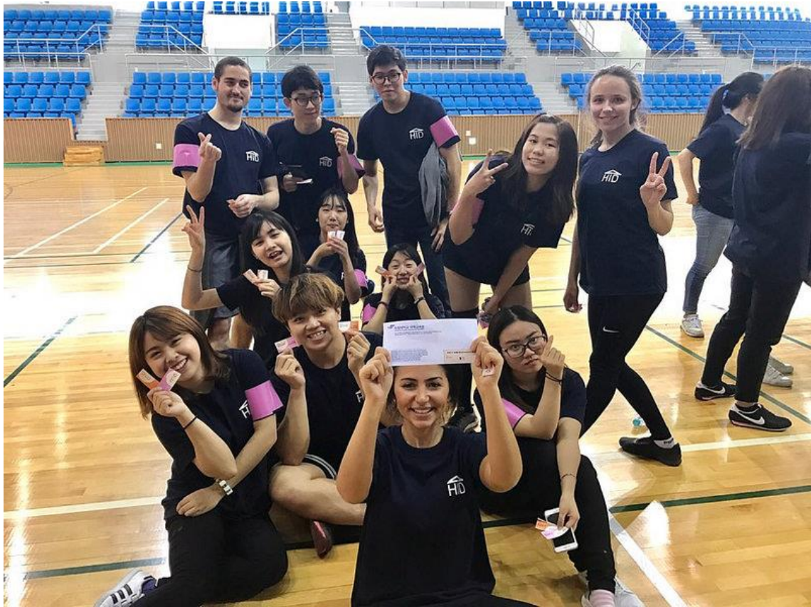
學校的學伴組織也會定時的舉辦相關的學伴活動，光化門、景福宮、江陵等許多觀光景點