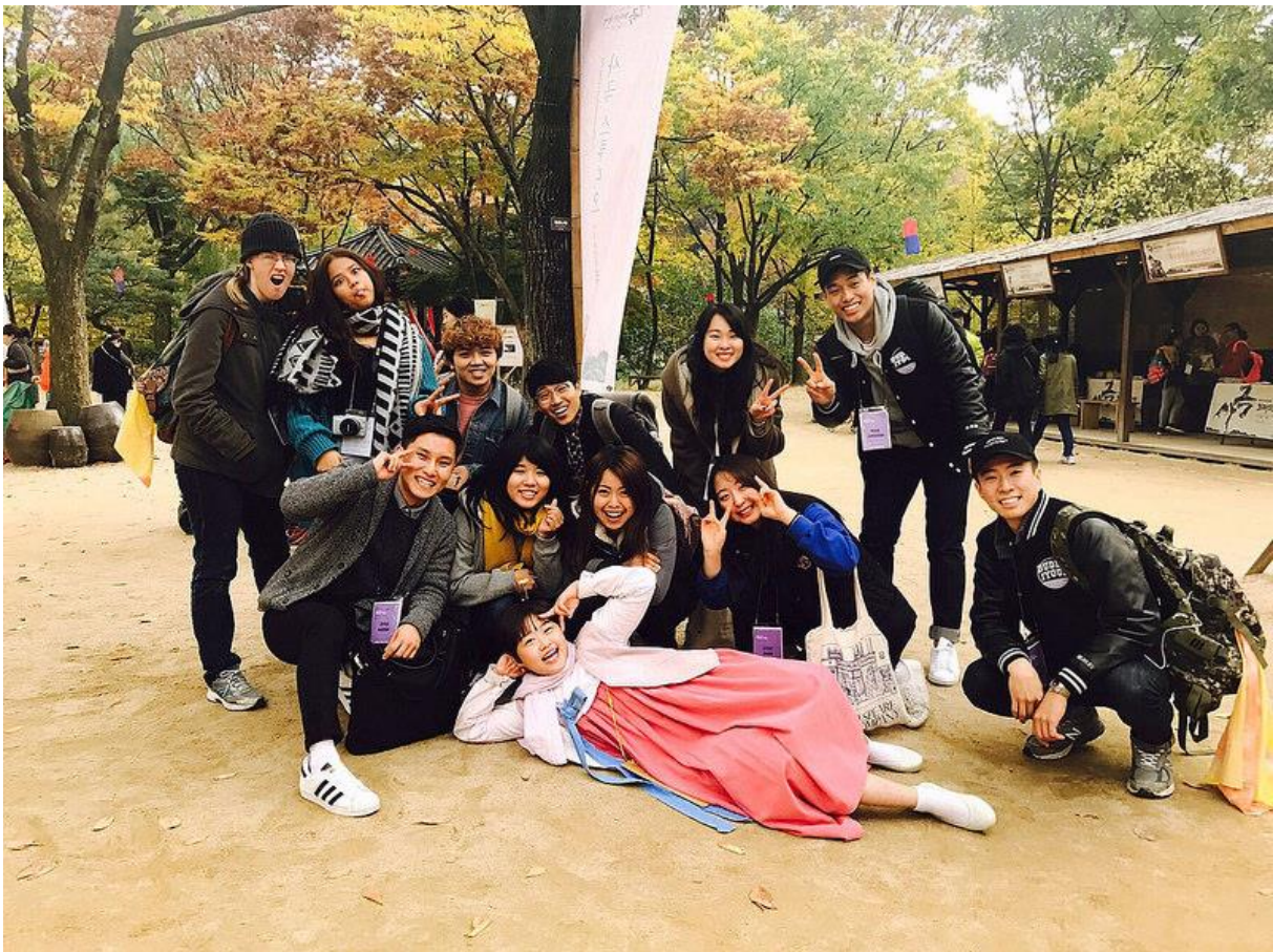
甚至在翰林大學校慶時，還擺設各國交換生的攤位，而台灣攤位當然是販賣具台灣代表性的珍珠奶茶，果然也獲得熱烈的回響。