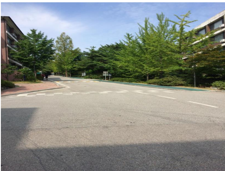
像山坡一樣的上學路

翰林大學位於韓國的春川，春川最著名的代表食物就是春川辣炒雞排，春川也是全韓國於冬天時，氣溫最低的地區，也因為是郊區的關係，空氣比起首爾來得乾淨，人們比起首爾來得還要更親切。翰林大學的醫學系在韓國可說是屬一屬二有名的科系，翰林大學同時也擁有一間專屬的醫院-翰林醫院，即位於翰林大學的後門，初次抵達翰林大學的時候，最讓我印象深刻的一件事就是，怎麼走校園像在爬山一樣，每條道路幾乎都是大斜坡，要去別棟大樓，需要走個 10 分鐘是基本，說不定這就是韓國人保持好身材的獨門秘方呢！