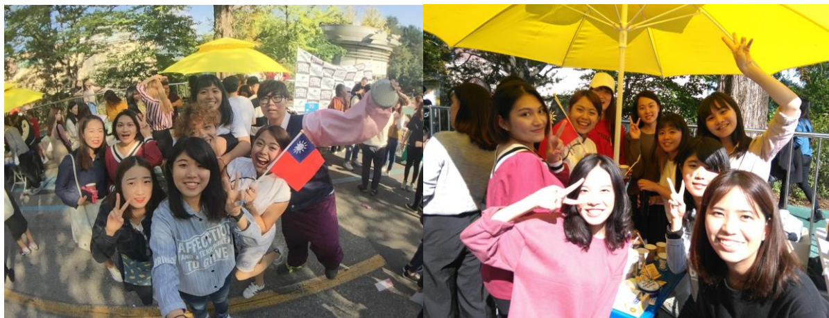
↑學校校慶，學伴組織舉辦的各種小活動，以及小吃，台灣攤子是做珍珠奶茶

一開始翰林大學的國際處會繼選課表跟選課清單的郵件給我們交換生，讓我們去填寫自己想要研修的課程，課程部分分為英、韓兩部分，前者是用英文教學的課程，後者是用韓文教學的課程，一開始去的時候國際處的老師會跟交換生討論韓文程度，然後建議我們所適合的韓文程度課程以防之後上課我們聽不懂或跟不上。基本上韓文課程從初級(發音及了解韓文字)中級韓文(文法、寫作、發表)、中高級、高級韓文程度的課程都有開設，除此之外英文課程、韓文課程都有開設一些了解韓國文化等等的課程，多樣化的課程提供給交換生選擇。除了國際處提供的課程之外也可以選修其課速度可能會比一般給交換生的課程老師的語速快，要不選擇一些全英的課程這樣課程理解也才不有太大差異。因此我在選課部分除了韓文語言課程之外還有修韓國文化了解等等之類的課程，上初級韓文課時，老師比較注重我們的對話以及對文法熟練程度，所以老師在上完每一課的文法跟單字詞彙，總是要我們兩兩一組來練習課文對話以及發練習單讓我們用文法寫句子，每一課文法上完之後都要完成作業並且繳交作業，這樣的學習模式讓我的韓文對話、寫作都有大幅度的進步跟熟練，因為每天都需要去練習對話及完成作業，加上課堂老師總是會耐心修改並糾正我們錯誤文法的地方而且上課氣氛輕鬆愉快，所以大部分的學生都會很認真學習並且與老師有許多對話互動及提問。