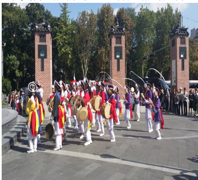
↑韓國傳統文化舞蹈

繩、打畫片、撿石子等等)非常有趣。最後一次我們去了江凌的烏竹軒，也是韓國幣值五萬元及一萬元的人物像的居住地方，更深的了解韓國歷史人物的文化之後也去了海邊與學伴們玩耍。每一次的文化之旅不僅有趣更增進我們和學伴彼此的友情及文化交流。除了古蹟文化體驗之旅，我們也會和學伴一起吃飯，他也會告訴我們許多韓國人吃飯、喝酒、生活習慣例如:他們吃飯通常一定配泡菜、大部分的人吃炸雞會配啤酒、啤酒一定要用冰杯子喝才好喝、大部分的人喜歡喝美式咖啡、在校內後輩要跟前輩打招呼等等一些文化，還教我們一些韓國人常常在喝酒時玩的遊戲即口號，我們也分享我們一些平常或過年常玩的一些遊戲，來處促進我們彼此之間的文化交流。在翰林大學這一年中，我參加了學校的熱舞社，之前在學校就很想參加之後因緣際會之下就來參加熱舞社，學生們都非常熱衷於社團活動，也常舉辦一些公演，也非常照顧我、教導我，因此我參與了一場公演，並且圓滿落幕。除此之外社團裡都會舉辦一些歡迎新生的歡迎會，歡迎會上會有一直玩多樣化的遊戲以及一直喝酒，增進新、舊生的感情。