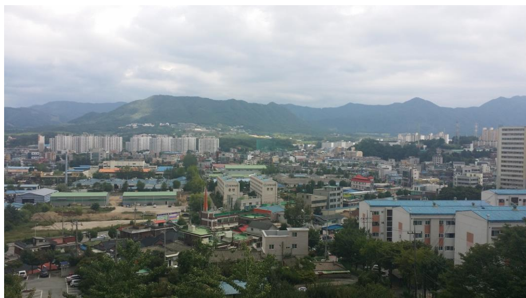
↑從學校宿舍的室外公共空間所拍下的風景

我在交換到韓國的大學是翰林大學，位於江原道春川市。校園整潔、校風良好、學生們友善、學伴組織完整有許多教學資源，加上教授、老師們都熱心教學，學校非常重視學生們節慶跟校內活動，所以時常支持學生們舉辦一些大、小型活動，不論是社團還是科系或者是校慶，學校非常重視並且贊助讓學生們自己舉辦這一些活動等等。此外學校也重視我們這一些交換生，再去翰林大學之前學校會給你選擇國際宿舍(HID)或者一般宿舍兩者大致沒什麼差別，前者會有比較多外國學生住根據語言選擇樓層且每一房會有一名韓國學生，並且根據選擇語言來面試通過後之後就入住，後者就是跟韓國學生一起住，因此我們會透過學伴組織所舉辦的一些活動或者是國際宿舍舉辦的活動來體驗韓國文化。翰林大學的學伴組織非常完整，有英、中兩個小組，每個韓國人可能帶1~3個交換生，每學期會有定期兩次的韓國文化體驗之旅，校慶時會有攤位讓更多韓國學生體驗不同國家的遊戲或者是飲食