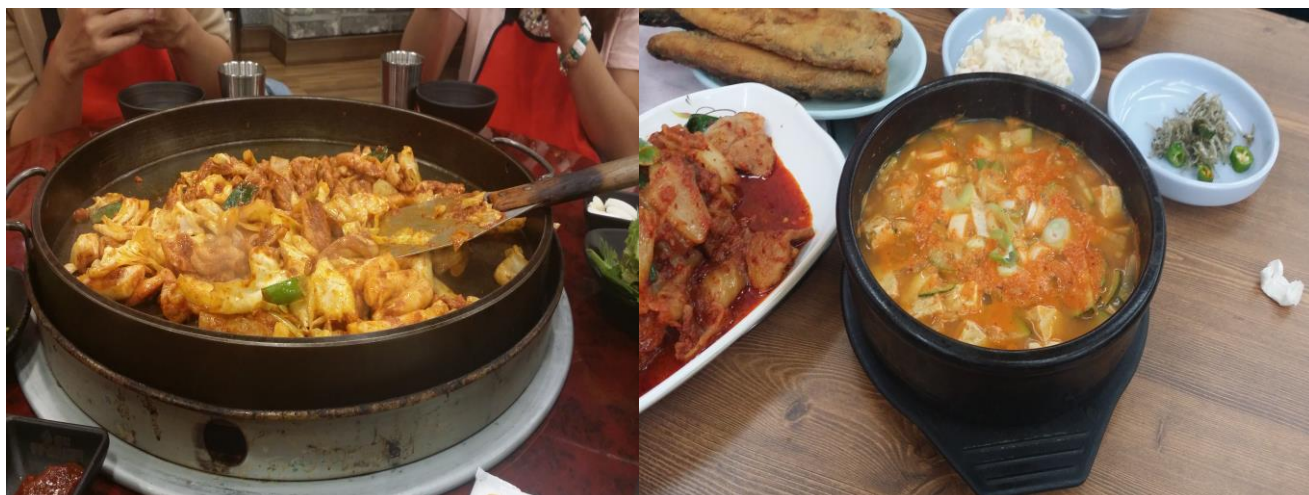
↑ 學校附近的辣炒雞排跟泡菜鍋食堂