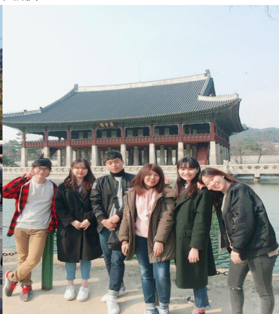
↑學伴組織文化體驗地點:景福宮