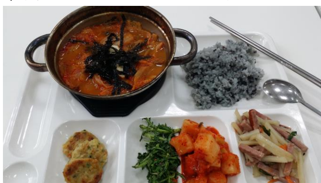
← 學校餐廳所販賣的午餐

韓國跟台灣相比物價方面本來就比較高，尤其在食物(吃的方面)，外面一餐最便宜也要 5000 千塊韓幣，學餐的話一餐都是 3500 韓幣，如果在飯後來點一杯咖啡來喝也要 2000~3000 千元，所以我們會選擇去超市去買較容易微波的蔬菜、水果、方便飯、及食物來當一餐，但當然不是三餐都自己煮來吃也會去外面吃好吃的食物烤肉等等，但如果搭配自己可以自煮的話這樣的話一個月可以省下不少錢，大約一個月的伙食費(不包含旅行的伙食費，其他都包含飲料等等)7000 千元左右，住宿方面，翰林大學提供給交換生有三種住宿方式，第一種是國際宿舍(HID)需要透過選擇的語言來進行面試，會有不同國籍及韓國人來入住，宿舍費相較其他兩個之下也比較便宜，這一年的住宿(兩學期)方面其實就跟台灣的宿舍差不多價錢大約 30000 萬元，像其他一些生活用品也沒很貴買一次就可以用很久，學校舉辦的文化體驗一次大約 500~600 元台幣左右包含伙食費、車費還有一些零食費等等，整體下來並不會太貴。此外，還有一些(化妝品、衣服等等)這些因人而異花費也會不同，像我給自己一個月的生活費大約 17000 台幣左右，這生活費包含(旅行費用、伙食費、個人物品費)，像我比較不常買化妝品、衣服所以這方面花費比較少，我都花在伙食費及旅行費比較多，因此在韓國生活的這一年總花費大約 30 萬左右。