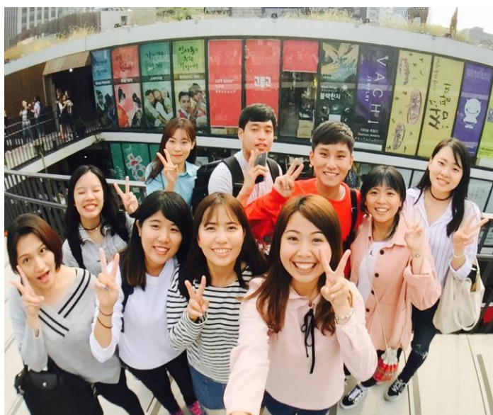
↑學伴組織文化體驗地點:仁寺洞以及清溪川