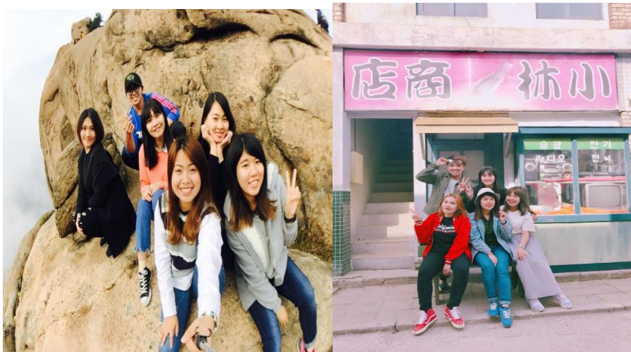
←跟朋友去東草雪嶽山國家公

在這交換的一年裡面，有許多辛苦的地方也有許多開心的地方，辛苦的地方不外乎是飲食不習慣、生病的時候，但在異鄉久而久之會覺得這些並不辛苦因為會有室友或是國外(韓國、其他國家)朋友照顧我、關心我，比起辛苦我更覺得開心，透過這次的交換學生的體驗讓我獲得不少經驗跟體驗以及增廣見識的各個層面，一年時間認識許多人、體驗不同文化、跟來自不同國家的朋友談天，增進自我廣見、擴大自我的交友圈、增加自我的勇氣自信心，跟這些朋友學習的點點滴滴都讓我收藏在心中腦海，很多人的認為會覺得學習就只能待在校園、房間、書桌前學習，但我覺得學習因該擴大範圍，讀萬卷書，行萬里路，兩者必須相輔相成才能算是學習，在韓國這一年我並不是只有一味的讀書，我選擇在我的空閒時間去旅行，在旅行途中我遇見不一樣的視野，跟不同的韓國人、旅客談天得知不同世界、不同想法，這樣的學習也是一種學習。在韓國一年的時間說長不長說短不短，很感謝所有幫助過我的朋友，因為有他們的協助讓我更加快速的適應韓國生活，也從種種不同層面(學習、交友、文化等等)收穫到不同的經驗及學習成果，真的覺得很開心跟幸運可以在我的學習旅程中有這樣一段交換學生的經驗，也很感謝有一群很照顧我、關心我的朋友。