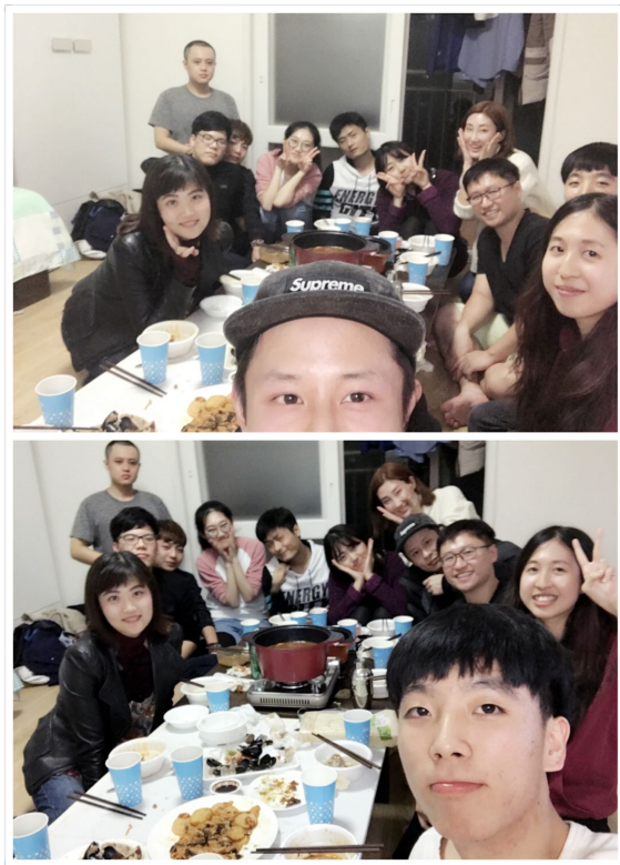
和中國留學生的聚會

到了國外，當然也要融入當地的生活，韓國人假日喜歡去看場舞台劇或電影，不然就是跟好朋友吃飯、唱歌或喝酒，在喝個解酒湯或是在桑拿房過夜，舞台劇展演場最有名的在大學路，我也看過一齣有搭配中文字幕的舞台劇，雖然場地很小，不過更有互動性，如果有遇到大型活動或免費的演唱會也不能錯過，小小的追星也很滿足。還有10月的時候在漢江有國際煙火節，雖然都人擠人，也想體驗一次，後來還跟朋友去了釜山，冬天還去滑雪釣冰魚，雖然韓國冬天真的冷到每一次出門，就會想念寢室的地暖，但一到假日都還是出門了，因為還有沒去過的或是想再去一次的地方。