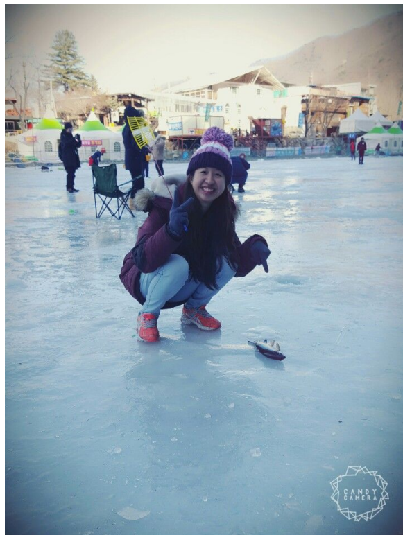
在結冰的河上釣冰魚