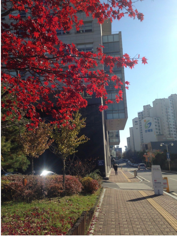
韓世大學校園一景

這次的半年交換，去了韓國的韓世大學，因為是轉學生，留學的消息也是朋友告訴我的，所以抱著對韓國的一點興趣，沒有想太多就報名了，也因為大四之後出國交換，要付全額的學費，不想給父母太多負擔，只申請半年。學校還開了一門給出國遊學同學們上英語溝通與表達課，我也認識了要去韓國交換的朋友們，不過這次從長榮大學過去韓世大學交換的只有我一個人，所以一開始有點害怕，而且自己的韓語能力也有限，大概只會說 這個多少錢？化妝室在哪裡？這些簡單的句子而已，不過到韓國之後，學校有請人來接送，而且寢室都是中國人，當然也有台灣的留學生，人都很親切，很快就成為朋友，所以就去參觀有名的景點，開啟了韓國交換之旅。