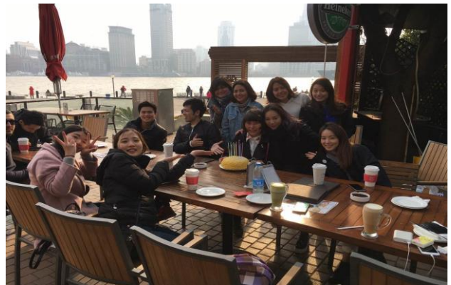
▲上海一日遊當天是室友的生日，大家一起慶祝

剛開學的一個月常常和室友們瘋狂地到處跑，知名的景點幾乎都去過(田子坊、新天地、南京東路、外灘、豫園)，上海有許多咖啡廳我們也跑了不少家，因為剛來所以覺得這裡每樣東西都很新鮮都會去嘗試，所以這一個月開銷相當大。