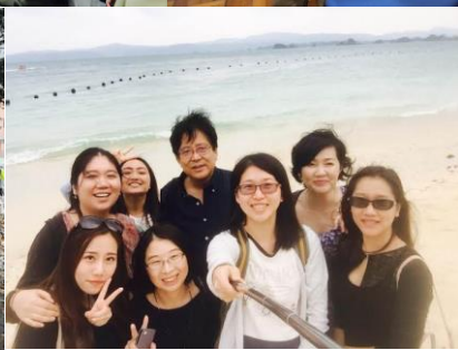
右上：歡送會前在研究生休息室 左上：歡送會上 右下：在沖繩的合照 左下：去群馬滑雪的合照

由於我是個基督徒，在去東京前就已經和當地的教會連絡過，並在那裏過了一年的教會生活，這段時間在教會內認識了很多日本、中國、台灣、各國的朋友，一起去很多地方參加活動等等，在海外的教會來日本教會拜訪時，有時也會幫忙擔任翻譯，受到他們很多的照顧，在關於日本文化方面不懂的地方，也常常請教他們，像是請教了浴衣的穿法，以及在穿完浴衣後，日本是如何清洗、熨燙、摺疊的，在即將離開日本之前，也是相當依依不捨，非常懷念和感謝他們，雖然已經寫了很多次，但真的認識了許多需要感謝的朋友們，由衷地感到這一年實在是非常豐富和寶貴。