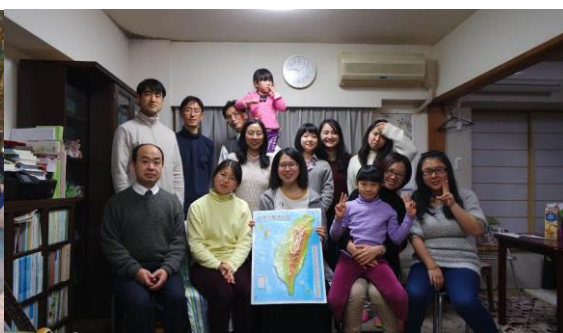
左上：上野動物園 右上：最後一天去參加聚會的合照 左下：夏天穿著浴衣和照顧良多的日本夫妻合照 右下：在富士山合照