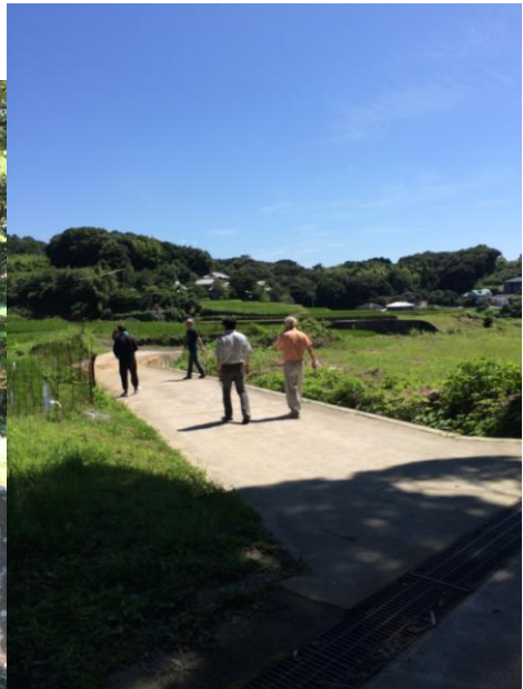
➤ 2015/08/17 去調查南島原 去吃素麵什錦麵