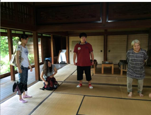
去調查附近的場所