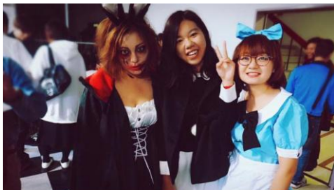
万圣节 🍊 哪里可以福一下