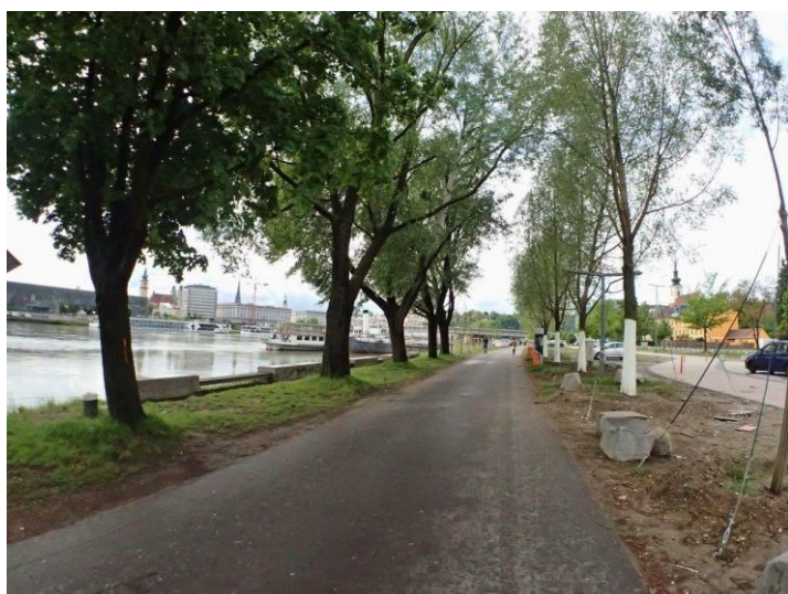
圖 3：多瑙河旁的步道，是我每周慢跑的起點