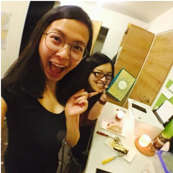
圖 10：不厭其煩地陪我練習德文的室友，牆上的便條紙是我進步的原因之一