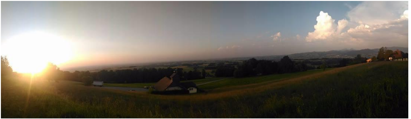
圖 9：鄰近小鎮山丘上的美景

時而停在原地，時而緩慢前進，時而故意沒有按計畫的衝動行事，這一年，改變了我看世界的角度，我體驗了不一樣的奧地利生活，也學到了很多，還交了許多珍貴的朋友，我很幸運，也很高興當初做了申請的決定！