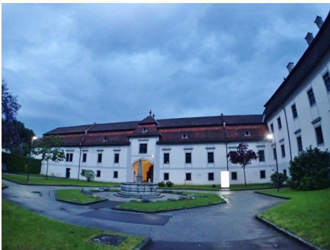
圖 1：校園內彷彿能穿越時供的一角

城市的範圍並不大，但該有的，能逛的博物館、歷史、百貨公司、人文慶典都沒少，學校及宿舍都位於整個城市最安全的地方，平靜且自在是我對這個環境的第一印象，由電車及公車組成的路網非常方便，只要 20 分鐘就可以從學校到達市中心，大部分的宿舍都位於校區附近，並且常常有學生們發起的活動；學生餐廳有著比校外餐廳都便宜的餐點，但只供餐到下午兩點，只要有時間，許多學生基於各種原因還是會選擇自己在宿舍煮。