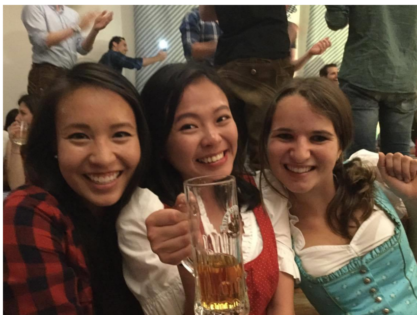
圖 9：九、十月每一間酒吧都會有一天來響應啤酒節，啤酒也是許多歐洲學生生活花費的一大部分