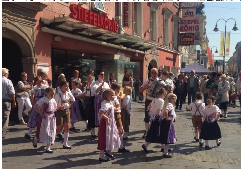
圖 10：周末市中心的小表演，大人小孩穿的傳統服飾帶我們到另一個世界