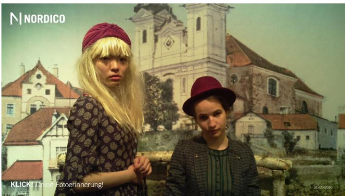
圖 5：假日和好友到市立博物館回到過去

到了林茲好一段時間才發現，我忘記了一開始來這邊的初衷並不是四處當背包客，最重要也最迷人的，是能夠好好享受這個城市的步調和生活。