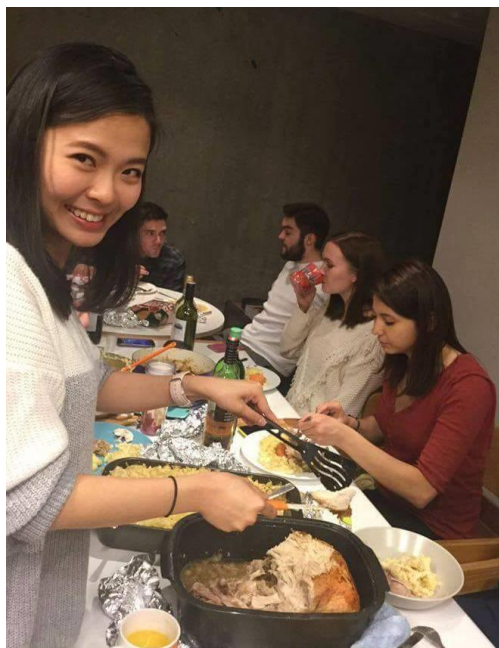
圖 6：感恩節一起準備的感恩節大餐（美國人的異鄉過節）