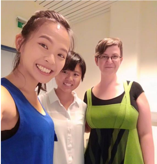
圖 4：可以讓學生的德文起死回生的德文老師