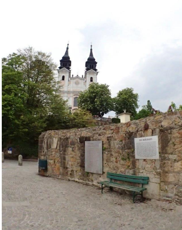
圖 7：佇立在山丘上見證著歷史的老教堂