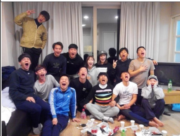
生活體育系滑雪訓練營