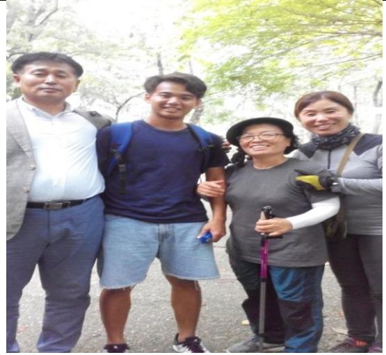
登山時巧遇羅州市市長(右2)