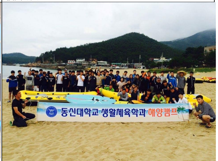
生活體育系海洋訓練營