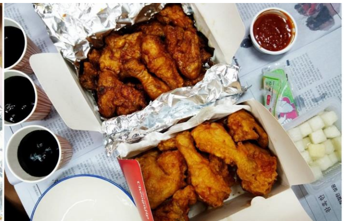
圖五、圖六 萬惡的雞爪和炸雞