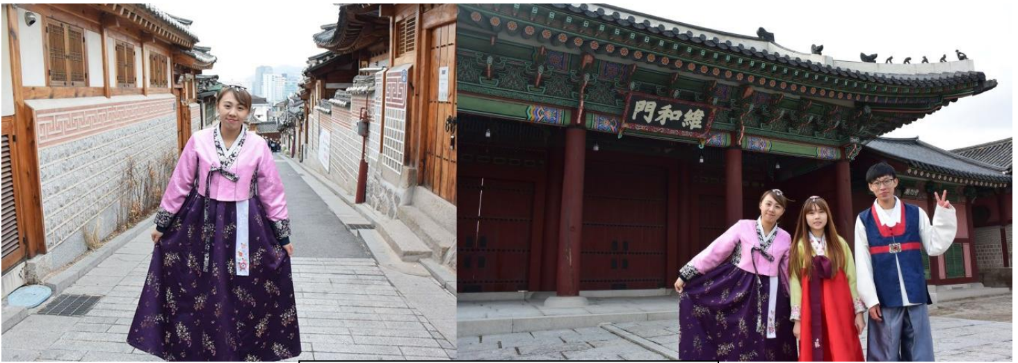
圖七、圖八 北村及景福宮(韓服體驗)

到韓國之後，其中一個假日裡就跟幾個朋友們一起約好，就到了韓國知名的古蹟-景福宮，還體驗穿著韓服到處跑，景福宮裡是只要身穿韓國傳統服飾都可以免費進場參觀，在裡面拍了很多照片，還遇到一群韓國大學生們問我們是從哪裡來的，聊天之餘叫我們在韓國要好好的完之後還跟我們合照，覺得是很有趣的際遇。後來我們還去了知名的北村韓屋村，走遍北村八景，就像是爬了一座山一樣，來到韓國之後有種一直在走路的錯覺，看到了很多韓國古代時後留下的建築，這些場景都是很多韓劇會來取景的地方，我們也遇到很多台灣來的觀光客，他們看見我們穿著韓服就跑來要跟我們一起合照，還問我們是在哪裡租的韓服很漂亮呢，最後我們走到了仁寺洞，那裏都是賣許多韓國傳統扇子及飾品的地方，也有賣韓國人用的扁筷與湯匙，很有趣的地方是在那邊所有的英文招牌都會變成韓文字的拼音，整個街道充滿了濃濃的韓國風情，在經過這天的韓國文化體驗，覺得很新鮮又充實，對於韓國的文化有更進一步的了解，也更加認識韓國的傳統建築。