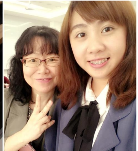
圖三、圖四 語學堂結業式 及 與老師合照