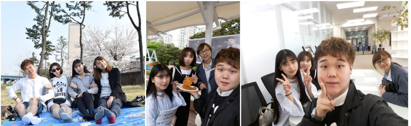
圖九、圖十、圖十一 韓國學伴與交換生們

在學校開學一個月時，國際留學生會有個申請學伴的活動，主要是增進韓國學生與國際學生們的互動與認識，可以互相幫忙做語言上面的交流，我們這組是一位醫護系的韓國男生來帶我和兩個音樂學院的中國學生，在這段期間裡，我們一起在圖書館讀書，學伴幫助我們解決在學習韓文上的困難，之後我們還一起去參加學校的校慶活動，有很多小攤販都是由他們自己去準備的，去嘗試韓國當地小吃。我們在櫻花開的時候，相約一起到漢江野餐賞櫻花，也一起去參觀清溪川跟光化門，很開心可以藉由這個活動認識了很多新朋友。