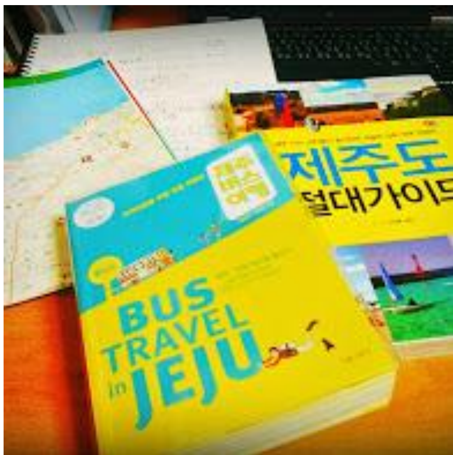
獨自去濟州玩時做的行前準備