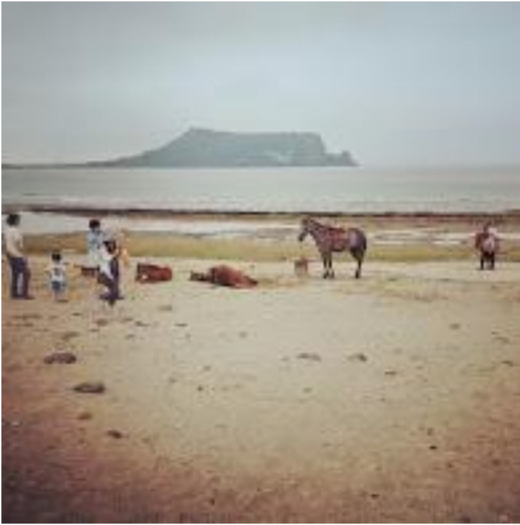
濟州島旅行時海邊一景

再來說到韓國人的個性還有行為，有時候並不像韓劇裡這麼美好，韓國人的個性就是什麼都要快，吃東西也快走路也快，不過這樣有一個優點，他們的網路真的是全世界最快，非常方便，不過也有缺點，我覺得韓國人講話非常大聲還有在路上常常看到韓國人吐痰，最讓我驚訝的是原來不是只有韓國男生會吐痰韓國的大嬸或是少部分的韓國小姐也會，冬天的時候，常會看到一個一個地上結冰的痰，我認為吐痰這個舉動是他們要改進的地方，雖然台灣人有些人也會做這種不雅的舉動，不過非常少，但是我覺得韓國人好像把吐痰認為是一種流行。