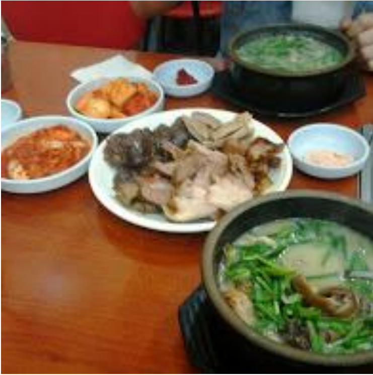
韓國血腸跟血腸湯