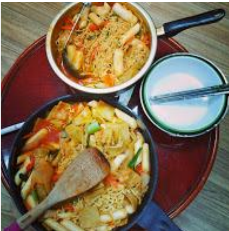
跟學伴一起做的炒年糕