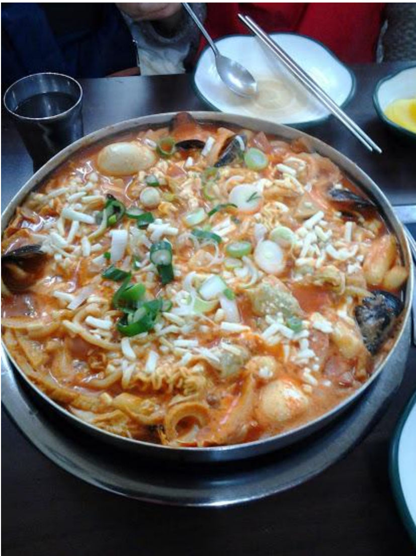
韓國有名的年糕鍋