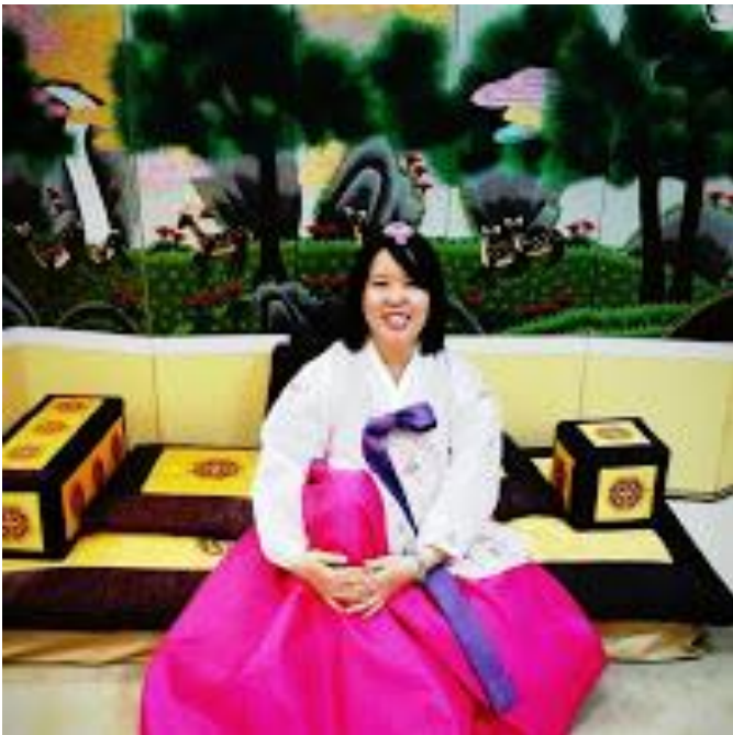
韓國觀光公社免費的韓國體驗