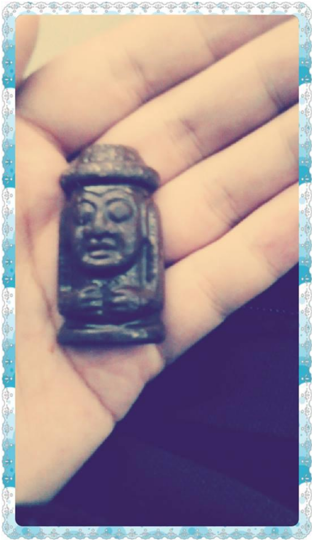
在韓國地鐵上讓位給韓國大叔, 送我的濟州巧克力