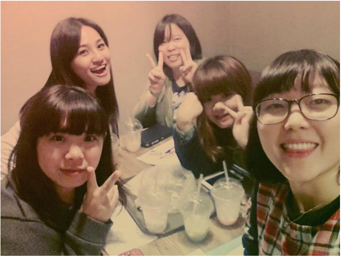
跟學伴一起學韓文聖經加喝咖啡