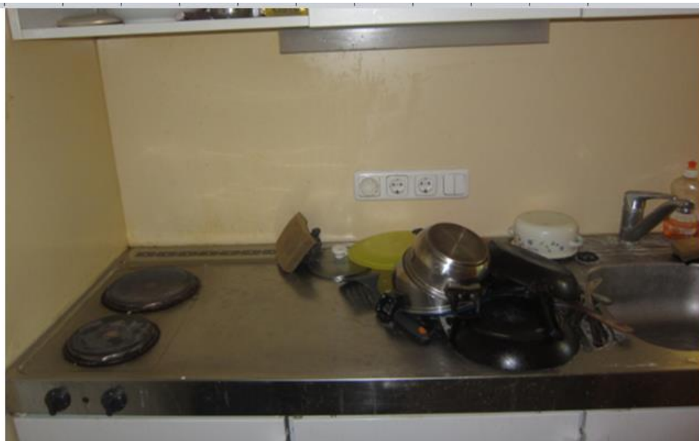
小廚房對我來說是太方便了,因為我不必跑去公共廚房煮東西來填我的五臟