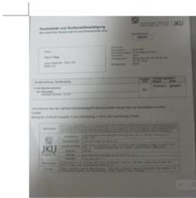
冬季學期可選課的 通知單