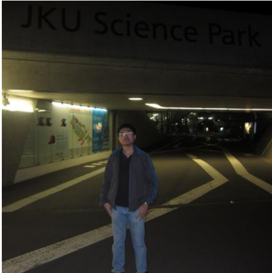
科技大樓,是他們這裡比較新的大樓,我冬夏季選修的課程都幾乎在這裡進行教學活動