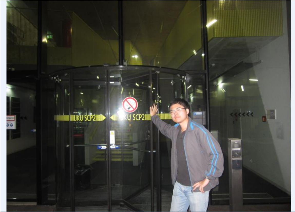
我這學期所選的專案管理以及跟老外討論的自修室的所在地