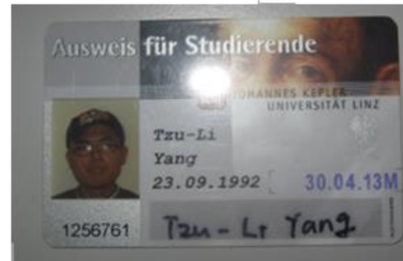
開普勒學校的學生證

個人開完帳戶後得到國際學生金融卡(順帶一提它本身是國際學生證,所以省去一項申請國際學生證的手續)