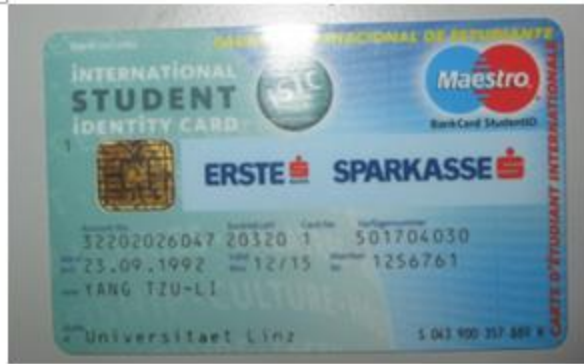
國際學生經融卡,他本身 也是國際學生證