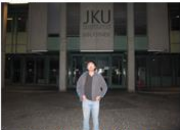
他們學校圖書館門口