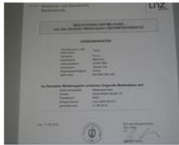
入住 JULIUS RAAB HEIM 證明