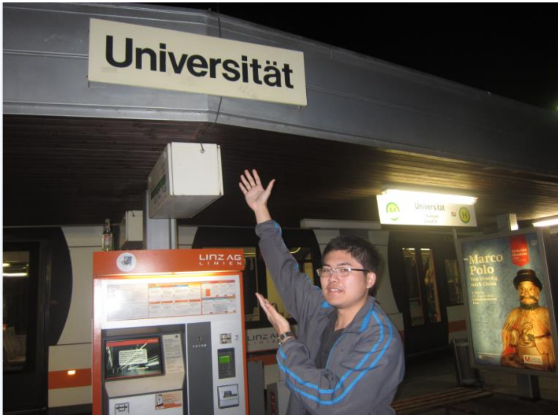
這就是我所說的 Zentrum(大眾交通工具),學校一出去就可以搭乘到你所想要的地方(例如市中心),圖中我所拍攝的地點就是在大學站的前面