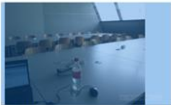
他們的自修室,這裡的外國學生都會在這裡互相研究功課

額外一提,這裡的學生都在哪兒準備考試呢?在我的母校大學的學生只要遇到期中考和期末考,我們都會在圖書館的討論是互相問答和複習,而這裡的學生,除了在圖書館讀書外,他們也有他們自修室進行複習以及討論功課