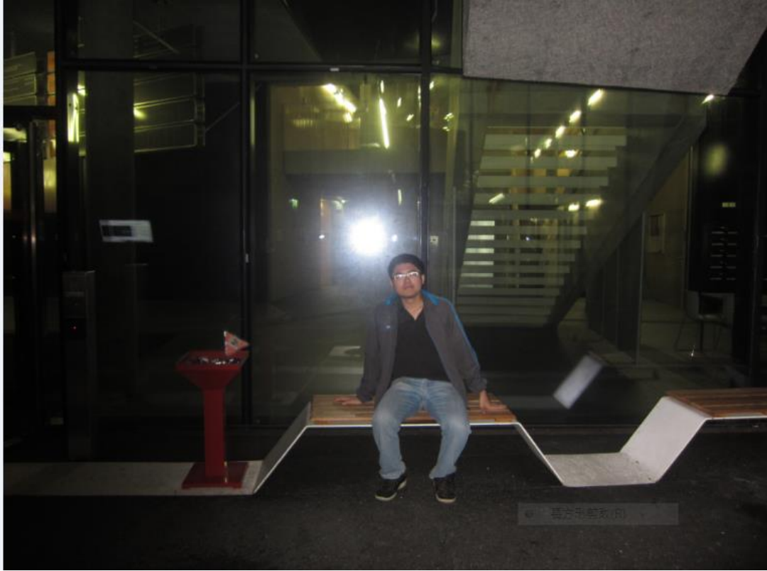
SCINENCE park3 多數選跟電腦資訊課程都是在這裡上課