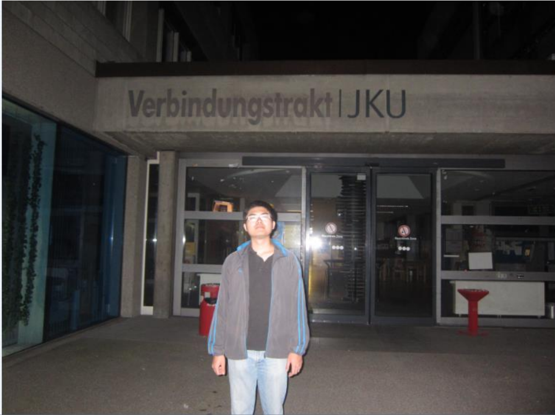
我德文課上課地點,左手邊是斧頭銀行,在最底部是連結化學實驗室,所每次經過那裏 都會看到瓶瓶罐罐的化學藥品