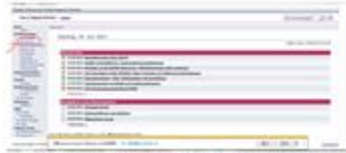
紅色部分指標為選課紐