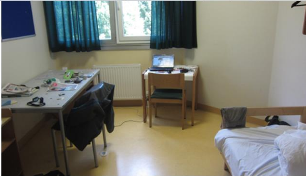
我的單人房,雖然房間租金不便宜,可是我很享受在這間房間的小生活