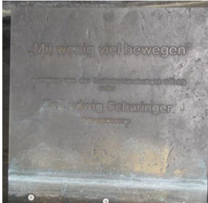
我個人認為這個雕刻品是這裡有意思的作品