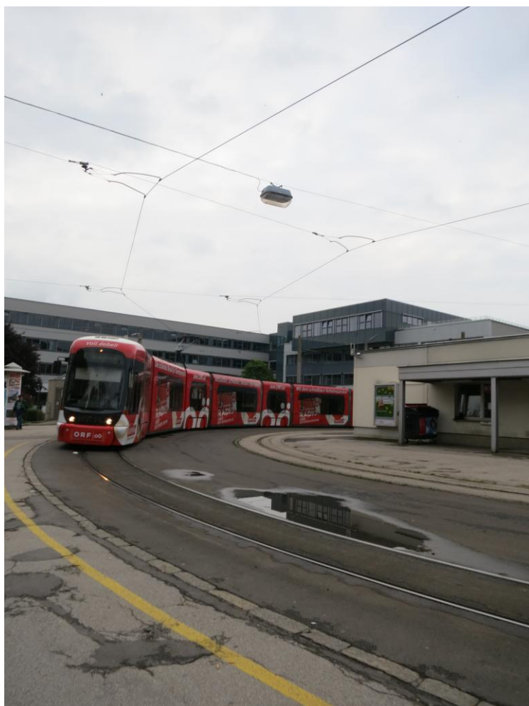
S-Bahn 路面電車，平日的代步工具

電車月票為十歐元 單程 成人 2 歐 21 歲以下 1 歐 日票 成人 4 歐 21 歲以下 2 歐