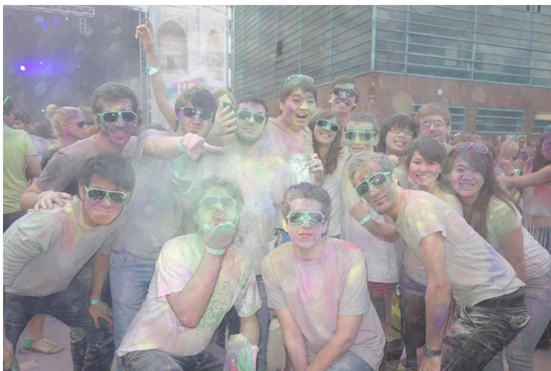
Holi Fest- 印度粉節

每次假期結束或是周末有時候亞洲交換學生也會聚一聚，聊聊旅行趣事交換情報，連絡感情。