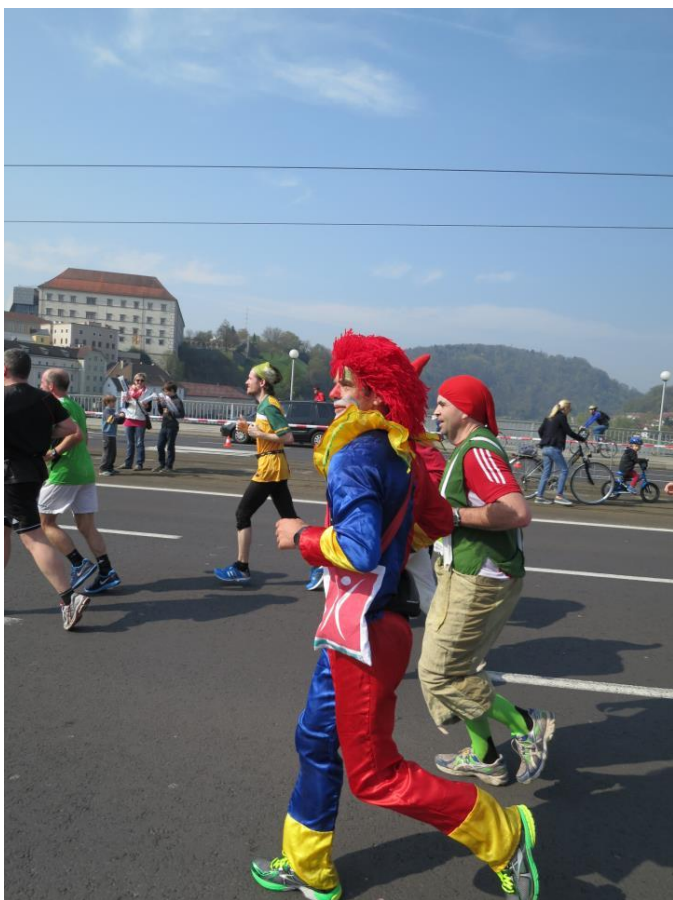
一年一度林茲市-馬拉松運動會 全市當天公共交通暫停，市民上街共襄盛舉！