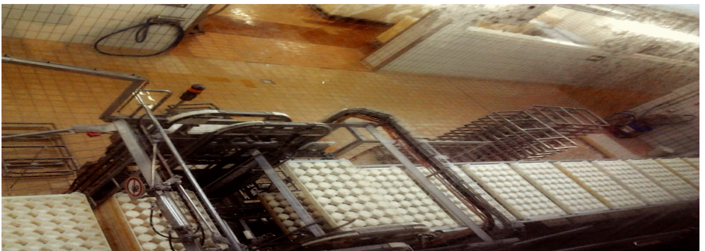
跟隨 REFI 所組織得旅遊活動所參觀位於奧地利的一個乳酪工廠

在 Johannes Kepler University 交換這段期間，所負責交換學生行程的學生組織是 REFI，各個交換學生被分配成小組由 REFI 組織當中的本地生當 mentor 帶交換學生了解學校相關事務及體驗當地文化生活。第一學期 REFI 計畫的旅遊是到捷克首都布拉格及溫泉小鎮卡羅維瓦力，行程需花費兩百多歐，對於第一次出去旅遊的我學習到了很多不同的經驗，在這段旅遊中到每個地方都有當地解說人員為學生們說明地方文化及歷史，起程及回程都有專車接送，讓大家在玩樂之虞也可以開心的出發安心的回家。在奧地利的文化當中，禮貌是不可或缺的，修課期間與老師的關係更是相對的重要，每門科目的老師授課理念及作法都不盡相同，選課之前務必要清楚老師所要求的配分比例，並且必須要清楚老師要求的目標而非一味的苦讀才能取得學分。(尤其是有申請獎學金項目所要求最低限度的學分更必須注意。)