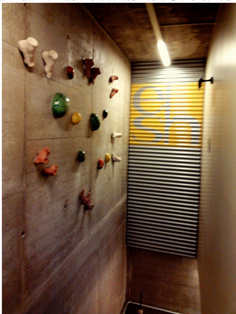
宿舍牆上充滿著現代感的裝飾

極為自律。每一樓都有一位樓層住戶選出來的樓長及副樓長，每一個學期都會召集樓層住戶開學期會議討論廚房的佈置以及樓層派對和樓層煮飯日(同個樓層的住戶在廚房和大家一起用餐的日子)和整潔相關方面…等等。除此之外，ESH 宿舍內可以算是最重要的一條內規就是看到人一定要打招呼(進出電梯或廚房或者是在廚房遇到別人在用餐要說用餐愉快等等)，以上這些事項我個人覺得對培養一個人的主動性以及對於群體的積極參與性有一定的幫助，非常值得借鏡。