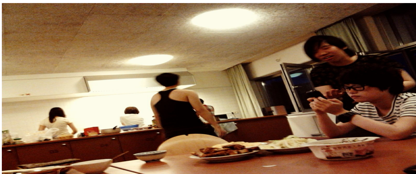
大家約去 ESH 廚房煮飯的某天晚上