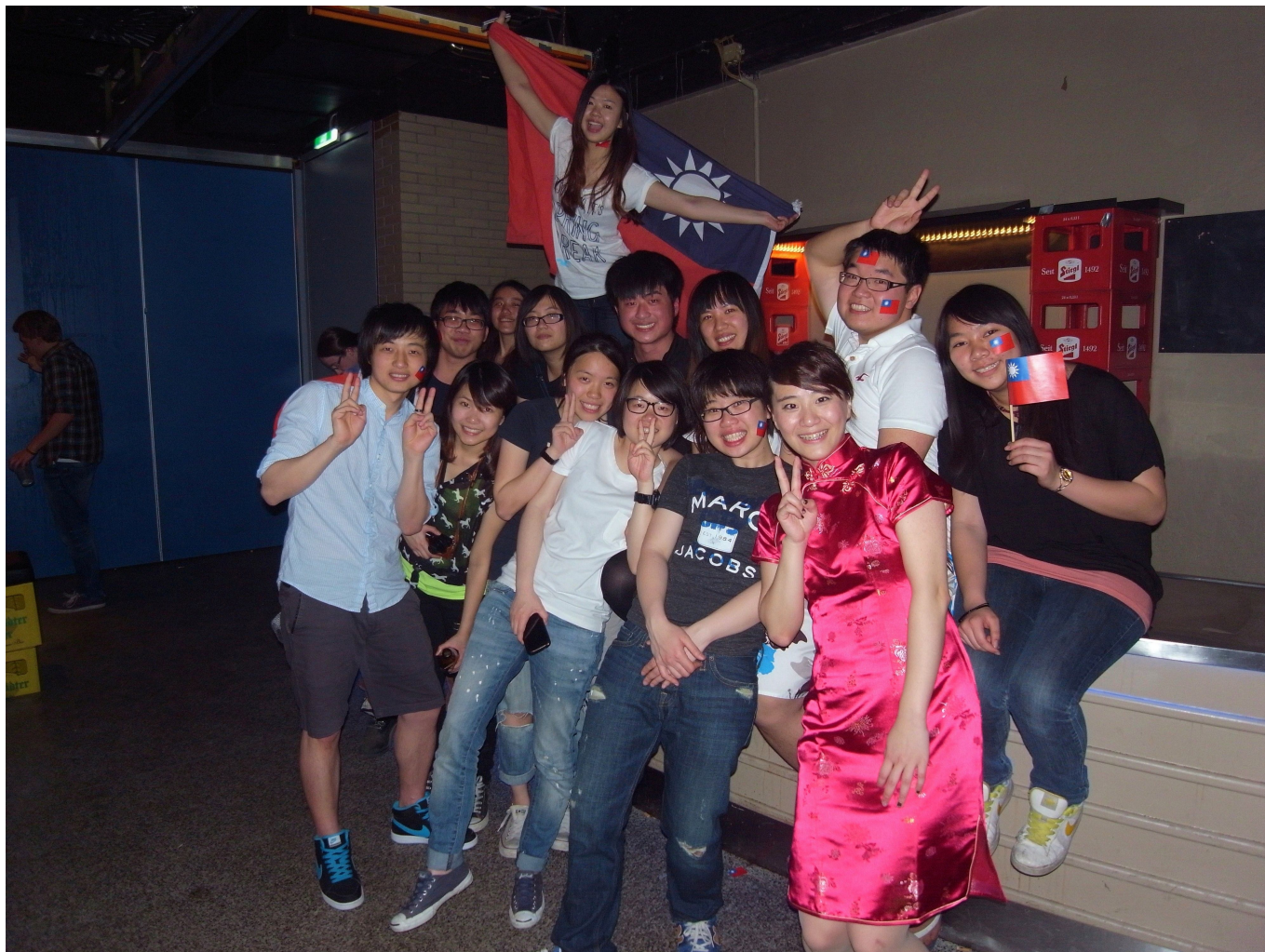
Asian Stammtisch 全體台灣學生合照