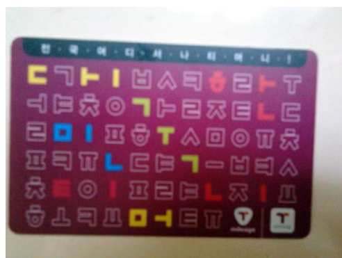
Tmoney card 款式很多，便利商店可以買到，儲值後使用

會搭計程車，有時搭公車，在學校醫院的門口有計程車站(目前計程車起跳 2800 韓幣，約台幣 80 )，在學校大門的旁邊有巴士站 ( 巴士一趟 1050 韓幣 )。住宿方面，我兩個學期都住 HID，HID 的宿舍費一學期 540000 韓幣 ( 兩個學期約台幣 31000 )，寢具一套 60000 韓幣 ( 約台幣 1700 )，寒假、暑假也可以繼續住在宿舍，一天收 6000 韓幣。另外，外國人需辦理「外國人登入證」，手續費 10000 韓幣，學校會幫忙辦理，需要 3 個禮拜時間。拿到外國人登入證後，可以到銀行開戶，辦手機，這些都可以請 buddy 帶你去辦理。馬上必須支出的費用：住宿費、寢具費、登入證手續費，所以建議先帶一些韓幣或美金，當時我帶了 1000 美金，到我開戶前都足夠花費。學校有銀行可以換幣，通常銀行的匯率比較低，若有到首爾，可以在民間的換幣所換到較高的匯率。