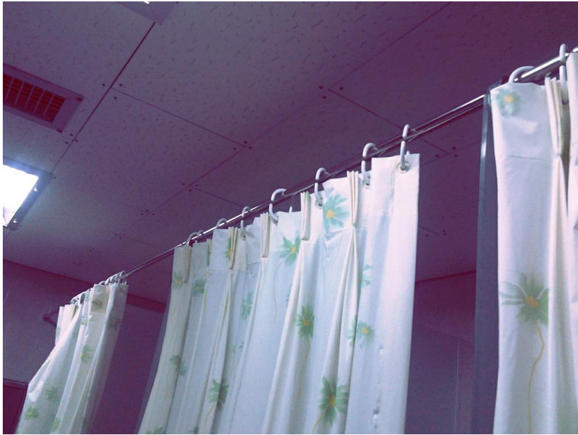
浴室 使用拉簾，霧玻璃隔間