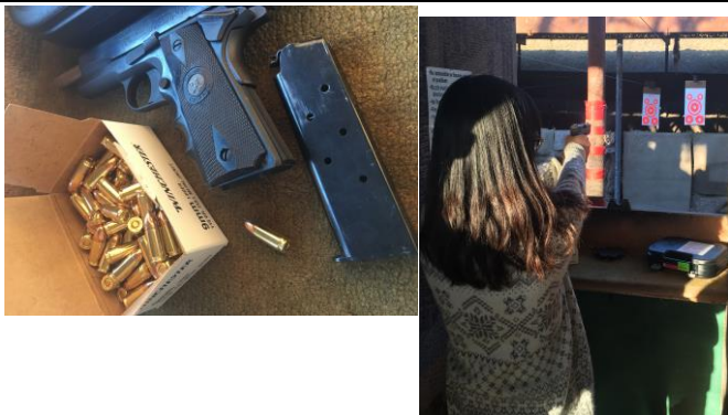
打靶的子彈以及槍