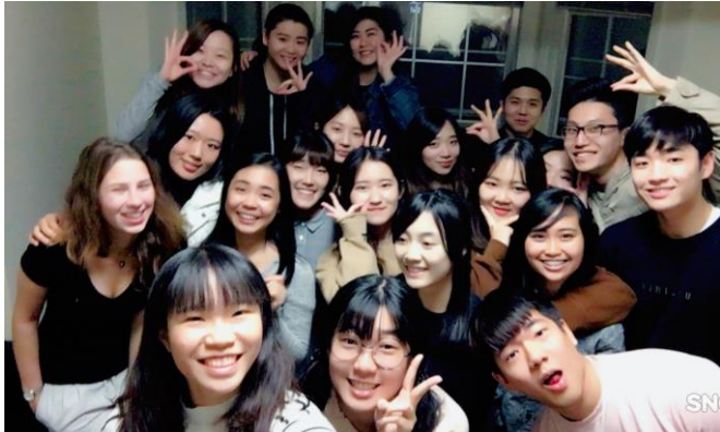
與交換學生們學期結束前的最後一晚派對