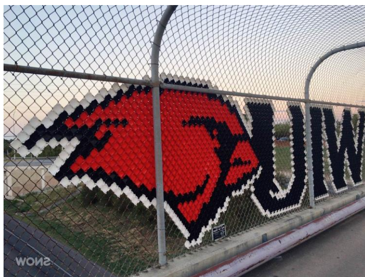
連接大學及高中的天橋上的 UIW 標誌

Incarnate Word 不只有大學，也有高中，Incarnate Word High School 就在大學的主校區隔壁，中間隔著一條高速公路，有天橋可以走過去，在我宿舍就可以看到高中的校區，被好奇心所使，有和朋友一起去探險，那邊的樹很多，有點很像小森林，我以為美國是沒有制服的，但是他們有綠色的制服，很漂亮。