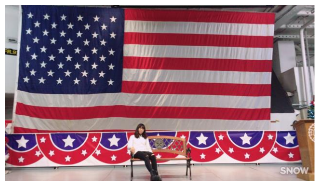
在 USS Lexington 上與美國國旗合照