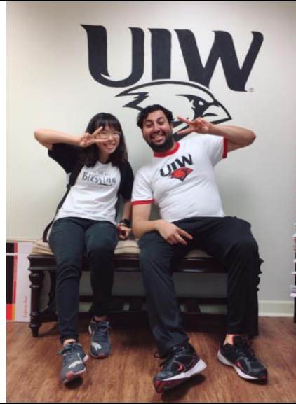
與沙烏地阿拉伯國際學生拍照