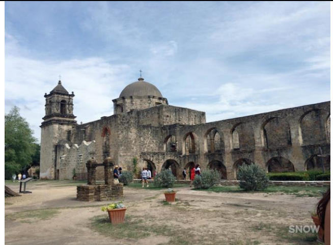
san antonio alamo