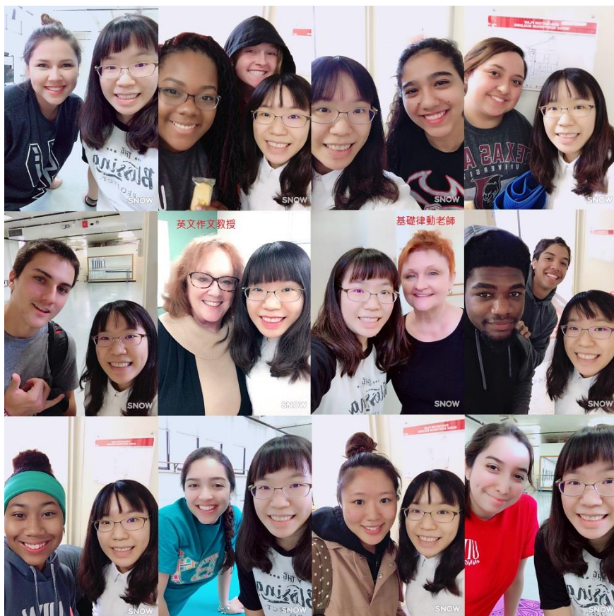
與教授以及基礎律動課 同學們合照

教授讓我們自己設計遊戲，遊戲裡要包含有伸展的動作，教授還會加入一些道具，例如呼拉圈、沙包、皮球...等，要我們融入到遊戲裡，我覺得很特別，體育課不只是動身體，也要動腦，還要激發想像力。而在基礎律動課堂中，教授會讓同學與同學組成夥伴，而且夥伴是一直改變的，所以我跟所有同學都成為夥伴過了，因為是體育課，與大家都會有肢體接觸，但是大家並不會因為要肢體接觸而不動，讓我見識到美國的開放，也因為這樣，與班上的同學都成為好朋友了。