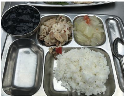
學校食堂(不辣的菜色)

四川是吃辣的出名，前往四川前，自己本身在台灣是不吃辣的，到學校後吃學校食堂一陣子，食堂內有辣與不辣的菜色，可循序漸進接受一點辣度，校外餐館、小攤可以要求微辣、中辣、大辣，在四川不吃辣會很可惜，串串、干鍋、冒菜、燒烤……許多知名小吃都是辣的，腸胃要要記得準備，因為食物是又辣又鹹又油，不適應的狀況是會拉肚子一陣子的。