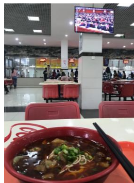
學校食堂 1F 自助餐式、2F 餐點式