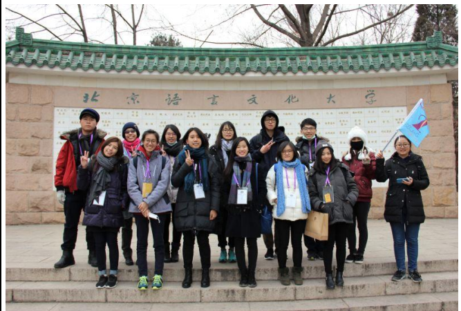
背景的牆是與北語有交流的國家 (第三組合照)