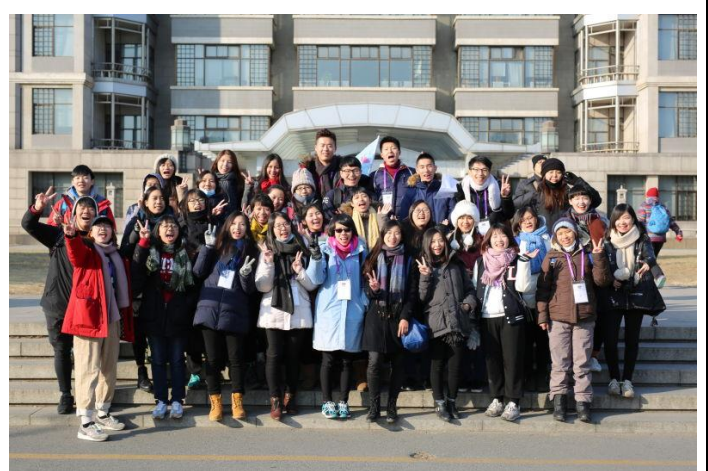
二車大合照(北京大學)