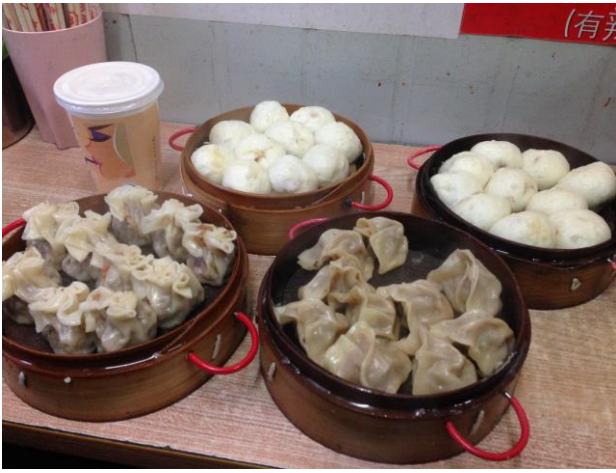
宿舍附近的早餐便宜又好吃