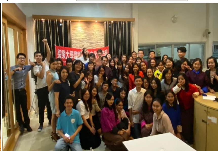
長榮大學翻譯系來這短期交流一星期，那時候派對我提議了一個老梗「雙人舞」，想不到可以快速讓各國學生玩在一起