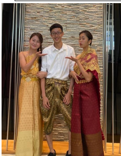
泰國傳統服飾體驗