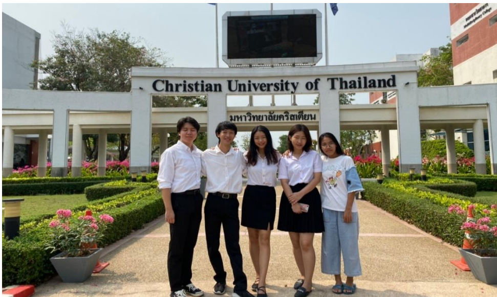
男生和女生的制服(注意不是最右邊那個)

可以事先跟一同前往的交換生約好一起訂機票，這樣學校接機比較方便，再告知他們航班和抵達的機場(曼谷有兩個機場)，他們會寄信通知在機場的哪個出口的哪根柱子接機，建議可以在台灣先辦少量的漫遊網路，有什麼突發狀況至少可以聯絡對方。