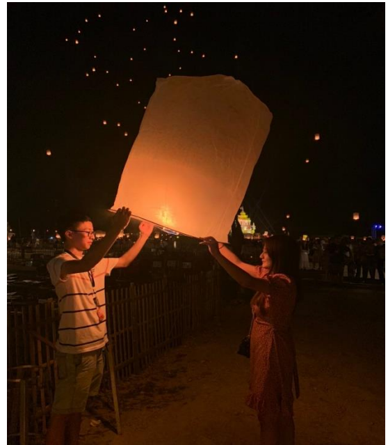
清邁水燈節：泰國兩大節慶之一，很值得一去