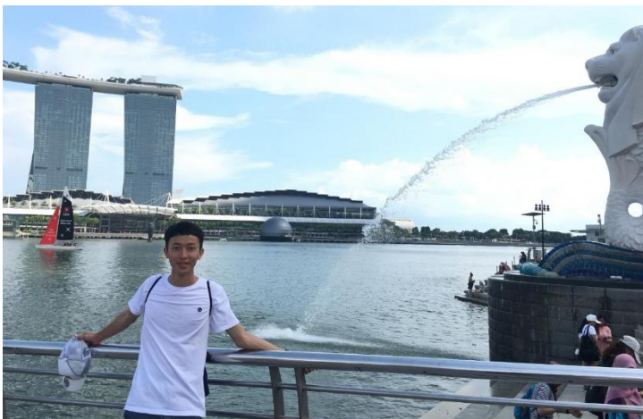
雖然泰國就很多地方能去，但如果有多餘預算和時間，也可以趁這個機會找朋友到鄰國走走