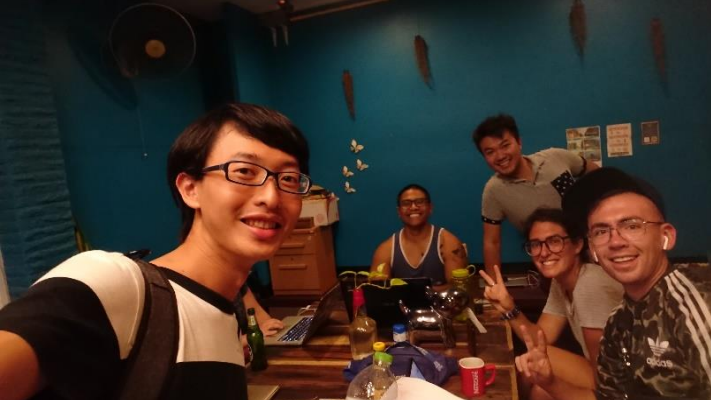
泰國是一個觀光勝地所以可以結交來自各國的好友