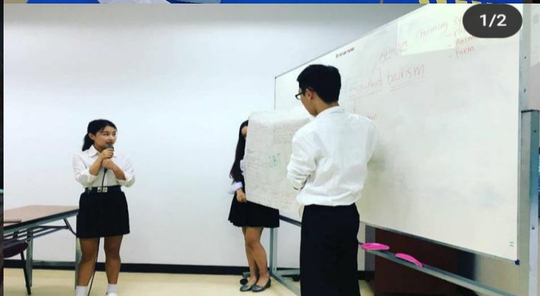
上課做的報告很多元，有手寫也有實體的模型