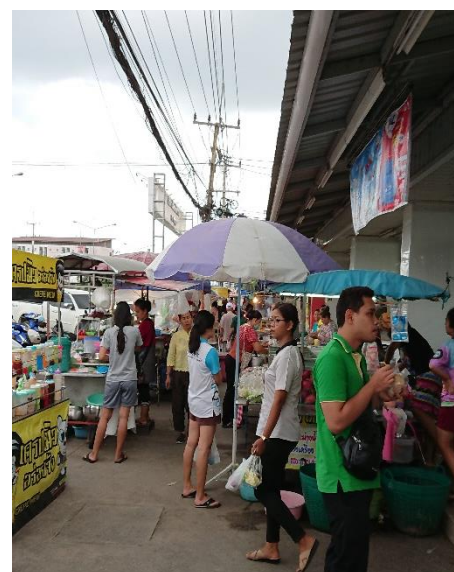
宿舍樓下的小吃街