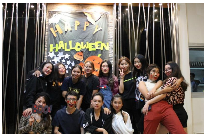
萬聖節被畫得有夠慘

如果經濟能力許可，建議可以多去旅遊，在旅行中最好的學習的方法就是「停看聽」吧！我是一個觀察者，同時也是一個偷故事的人，我很喜歡坐在咖啡廳觀察來來去去的人群，猜測那個小孩準備要被他父母教訓了，又或是那對情侶等等是不是要吵架了，很好打發時間的一個休息娛樂；我也喜歡在青旅的大廳和來自各國的人分享著不同的故事，多去跟人交流，不要害怕溝通問題，很多時候我也都是用肢體語言，還有笑，就是世界通用的語言了！跳脫教課書，親身去體驗，不然你怎知道不丹人的團結、泰國人的熱情、歐美人的慵懶，放慢自己的生活步調，去觀察身邊的人事物，傾聽每個人的故事及遭遇，我相信這些在未來都是很好的養分。