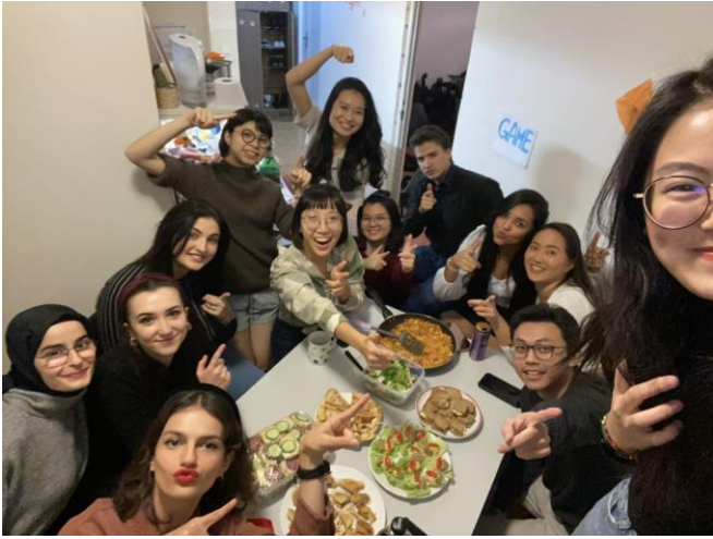
圖五 歡慶生日派對