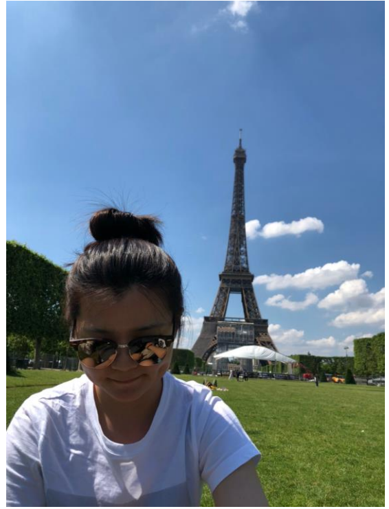
圖九 永生難忘的巴黎行

淚如雨下的經驗則是最後一個月在巴黎著名景點艾菲爾鐵塔旁，因為好奇心去接近路旁地攤，結果發現這其實是很典型的詐騙手段，在倉皇之下我總共被騙了 300 歐元(相當於 10,000 元台幣)，等到我意識到攤販已經捲款跑走只留下錯愕的我，不斷在人海中搜尋他們的身影只盼有一點點希望，但隨著時間流逝，偌大的廣場早已無影無蹤了。隨後立刻打了通電話回家，一聽到媽媽的聲音，淚水立刻止不住的潸潸流下，我只記得電話的那端很冷靜的問護照跟提款卡有沒有不見，因為如果證件遺失事情就會更為棘手，也直說著人沒事就好。但那瞬間真的好傷心，覺得自己為什麼不提高警覺，因為好奇心而接近攤販，但是後來再回想起這個慘痛的經驗的確為我上了一課，整件事情我所學到的不僅是詐騙的手法，還包括自己要怎麼預防這種事不要再發生。從中吸取這次的經驗轉換成長的動力，讓我從交換生活中又上了一堂珍貴的人生歷練課！