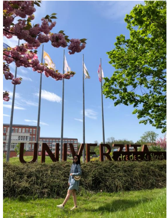
圖二 櫻花盛開的校園

圖二為四月份春季時，學校的道路兩旁會開滿粉紅色的櫻花，宿舍周遭也會有，花季最盛開的期間約 1 周，我們特別選了一天前往校園拍攝了許多照片作為紀念！