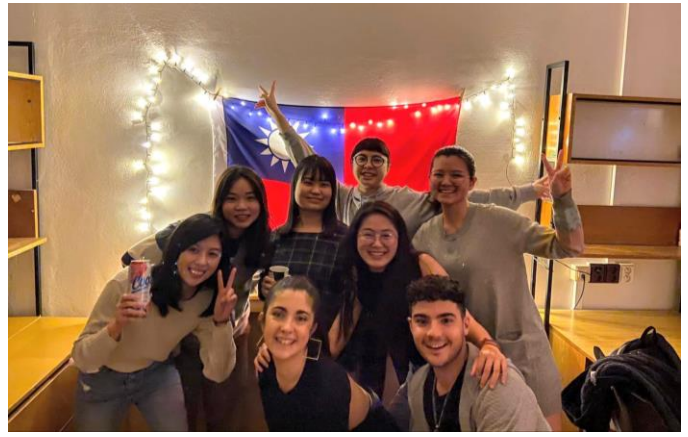
圖六 品酒交際派對