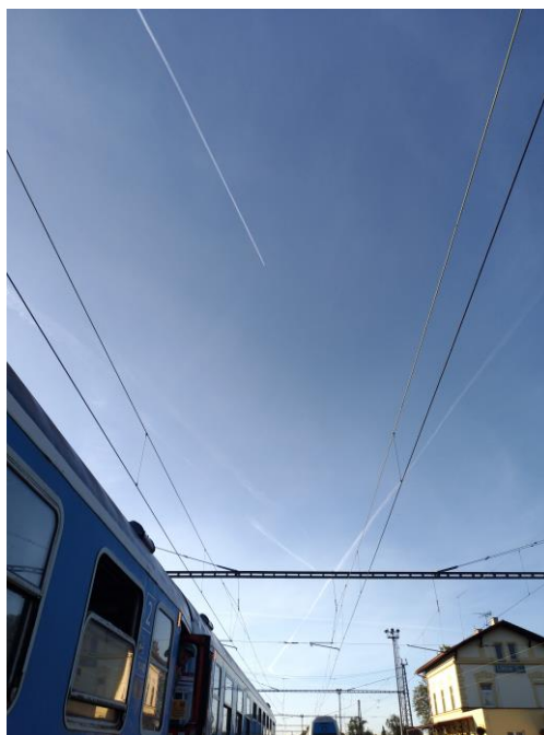
圖一 等待火車事故排除

下午兩點抵達機場領取行李後，迎接著我們的是學伴們及舒爽微涼的布拉格秋天，卻也是到達宿舍前的一連串挑戰，幸運的我們碰上了火車事故延遲了近四個小時，圖一就是在等待火車事故排除時下車拍攝的景色，並等候調度另一列車接送，回宿舍的途中沿途需轉乘地鐵、公車及火車，順利的話約莫三個小時就可以從機場抵達宿舍，但我們至晚上凌晨 12 點才完成宿舍報到手續。由於宿舍的住宿費只能刷卡，不接受現金，此時我卻發生刷卡機顯示交易失敗，無法付款，宿舍遲遲不願通融讓我先入住隔日再補刷，因此只好求救和我同住一室的室友替我刷當晚的住宿費，我才能得以領取寢室用具和鑰匙，以不至於露宿街頭。因此建議同學出國可攜帶一張以上的金融卡或信用卡，來預防其中可能會有刷不過或是銀行剛好在處理國際交易過賬導致系統暫停交易的問題。