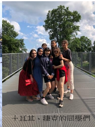
土耳其、捷克的同學們