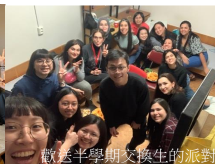
歡送半學期交換生的派對