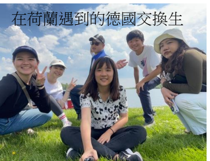
在荷蘭遇到的德國交換生