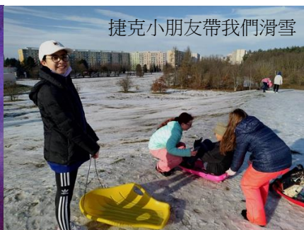
捷克小朋友帶我們滑雪