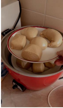
圖左是自己做的饅頭