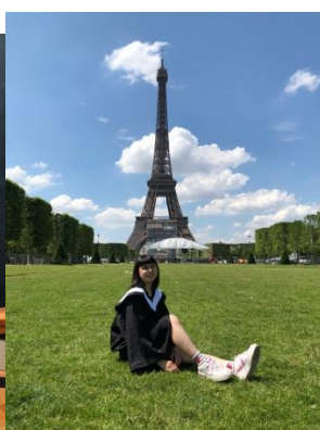
(圖中) 巴黎鐵塔前的我