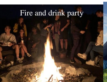
Fire and drink party