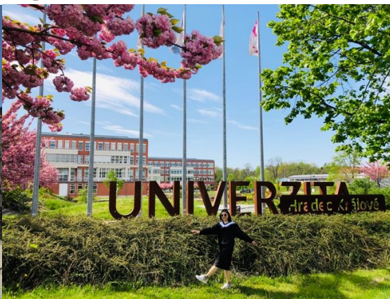
(右圖)為夏天開滿花的學校大門口