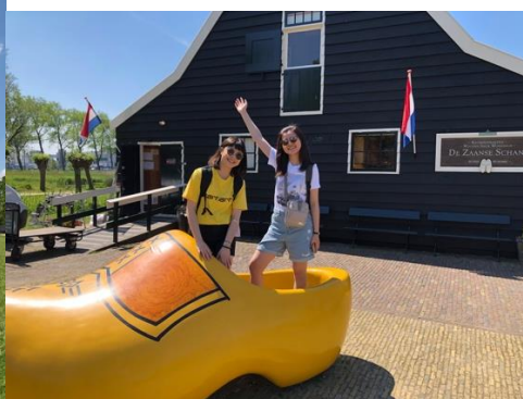
(圖右) 荷蘭的木屐鞋