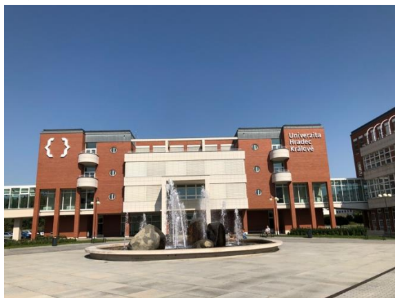
(左圖)為 UHK 的 building J

University of Hradec Kralove 共有四個院，分別是藝術學院、IT 與管理學院、教育學院和自然科學學院，而我們都是被分配到資訊管理學院 Fakulta informatiky a managementu (FIM)，由於疫情的關係我們並未到學校很多次，只有在開學前兩週有到學校註冊及進教室上課，本院的教室及活動範圍都是在 building J。兩週後因捷克疫情攀升所以改為線上上課，就一直持續到下學期期末了。所以連當初學校的 ESN 組織所辦的交換生交流活動也都取消改為以線上的方式參加;但還是有把握到第一個禮拜辦的 welcome picnic，認識了來自不同國家的交換生。