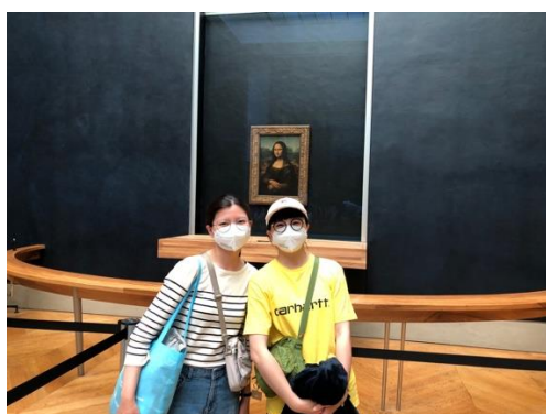
(圖左) 羅浮宮的蒙娜麗莎

在這九個多月的交換生活下來，說長不長短不短，但真的也不會後悔在這個疫情嚴重的時候出國交換，因為在捷克的所有日常和發生的事我都覺得很值得，能夠在文化不同、用著陌生語言的異國生活這麼一段時間，且熟悉的就像是第二個家一樣，沒有感受到多麼的不適應和不好的，因此如果你也有一股想出國交換的衝動，那你可以把握這個機會，它可以幫你創造不同的人生經驗，但還是要保有自己出國交換的初衷及本分，做好一位交換生該做的，勇於開口、學習各方面都會有所進步的，拋開眼前所有，享受當下，美好回憶都會是屬於你的。我也很感激這個交換經驗為我創造的一切，一直以來都算是被保護得很好，從未離開家這麼久過，也是我第一次體驗宿舍生活，樣樣都要自己來，但也讓我在這段期間成長、學習、磨練和看開了很多，很開心自己跳脫了舒適圈去嘗試新的生活。而且到捷克生活後才會發現台灣的方便之處，雖然西方國家的教育方式也是蠻值得效仿學習的，但有時候真的也會被他們的辦事效率給搞瘋，這邊有個小插曲就是我在要回國的前幾天測了 PCR 但到要飛的當天早上都遲遲沒收到檢測結果，去了現場問跟一直打電話給實驗室都遲遲得不到結果，終於在要出發的前半小時才收到消息，真的是到要幫捷克生活劃下句點都還讓人如此緊張。但是這九個多月的交換生活依然是讓我感受到最放鬆、最瘋、最自在、受益良多的一段時間了，集結了所有的喜怒哀樂。未來有機會我會再回到捷克看看它的。