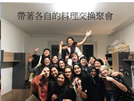
帶著各自的料理交換聚會