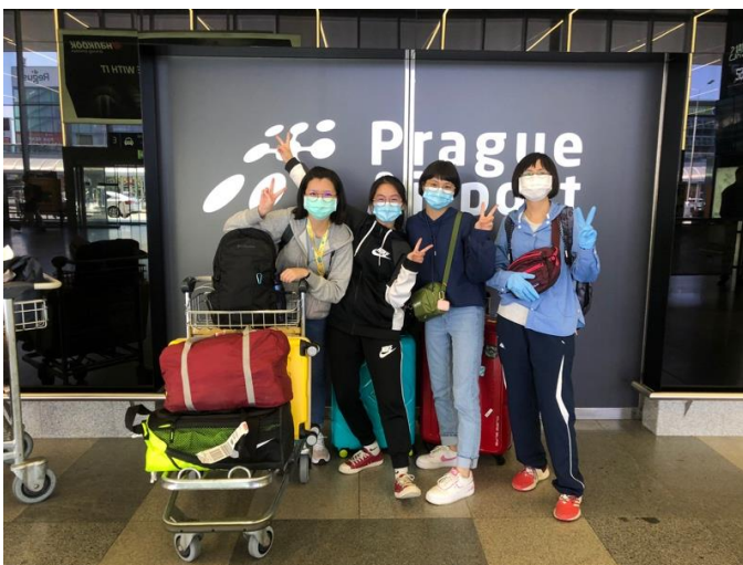
此圖是來接機的學伴替我們拍的合照

1-3. 接機：確定要到當地交換後，學校會用信箱提供申請學伴的方式及加入學校交換生的群組，到時候可以等候學伴認領以及安排接機的是，我們剛好大家都是選擇搭同班機一起抵達布拉格，然後剛好也有其他學校同樣是要到 UHK 的交換生，因此有特別安排了兩位 UHK 的學生來機場接我們全部的人一起到宿舍。車程從機場到 HK 火車站約 3 小時（含機場公車、布拉格地鐵和火車），接著再搭 20 分鐘的公車到宿舍，接著宿舍會由 Reception 安排每個人簽相關合約及繳宿舍費用+2000 克朗保證金，就能拿到鑰匙及寢具入住了！