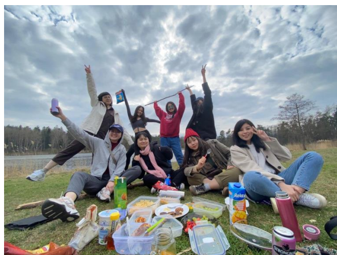
左圖是第二學期所有的台灣交換生一起去野餐