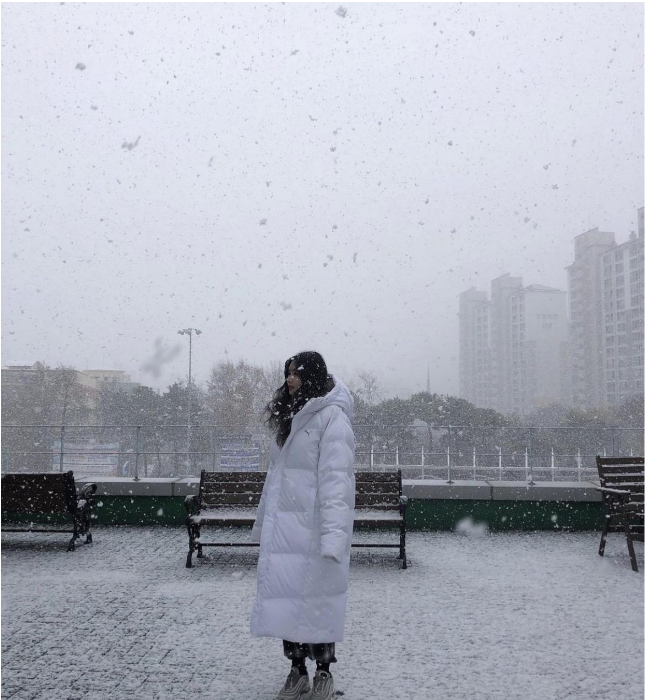
這是在韓國上課上到一半，突然下起了大雪，就跟韓國的同學去外面玩雪 跟之前在台灣合歡山的產雪感覺起來截然不同！