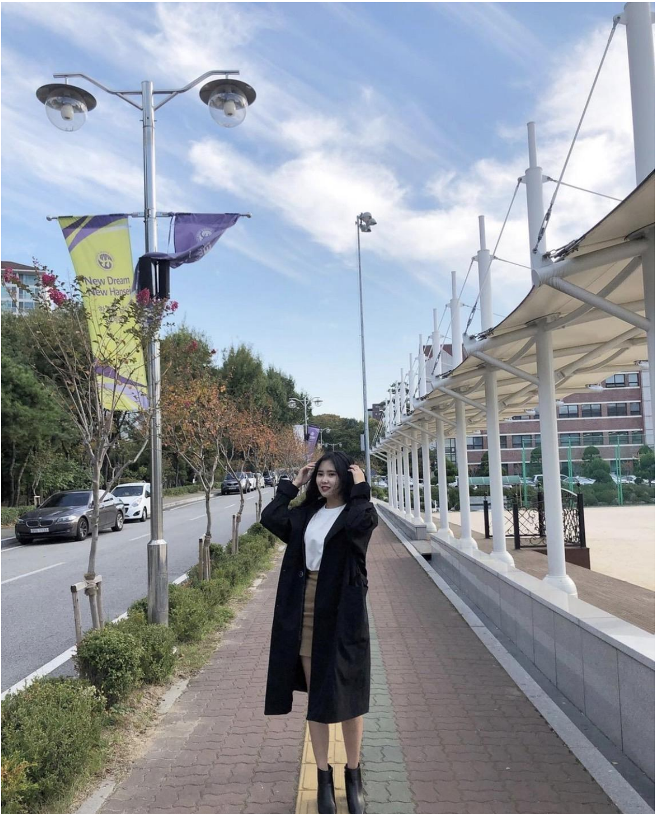
剛好季節是在秋天，走經過校園就叫同學幫我順手拍了這張照片，旁邊的樹葉都顯得秋紅了。