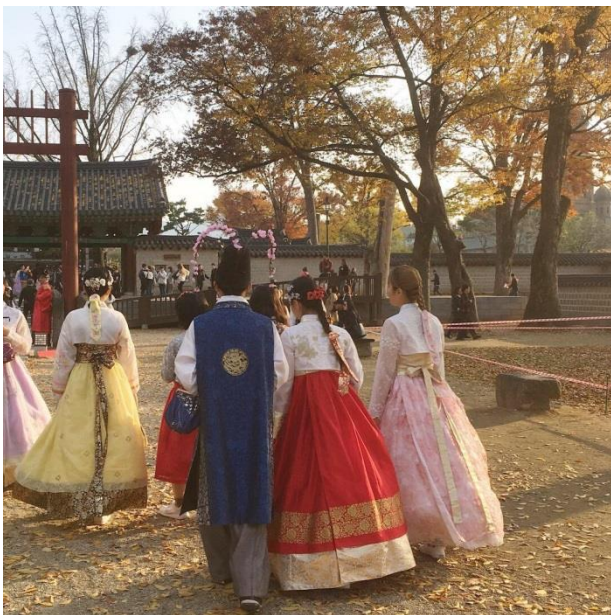
和朋友在全州穿韓服