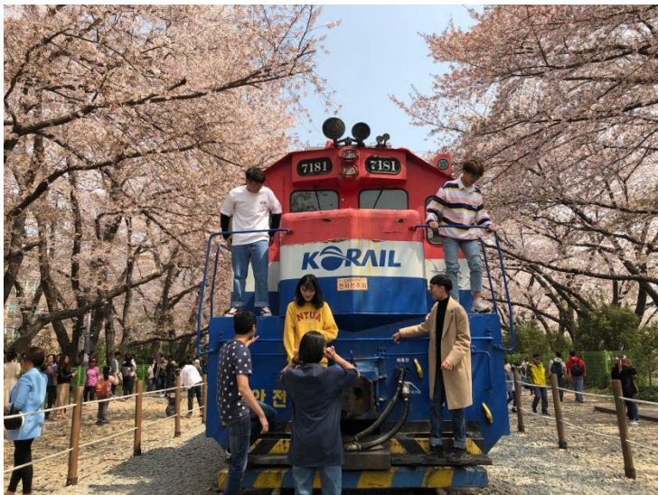
和朋友一起到鎮海賞櫻