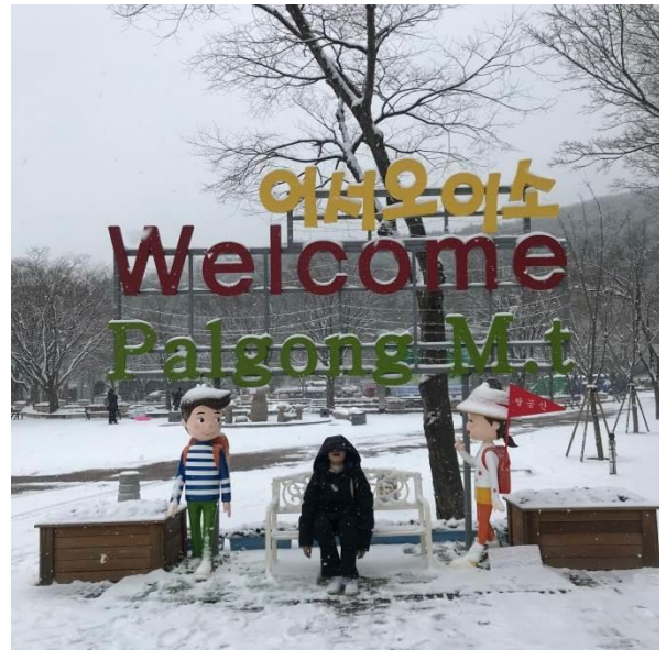
和朋友在下起大雪的天氣去爬八公山