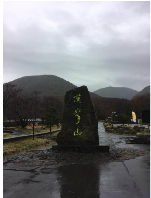
到濟州島爬韓國第一高峰-漢拏山