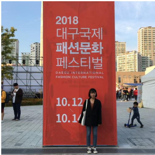
為了做報告來參觀大邱時尚文化節