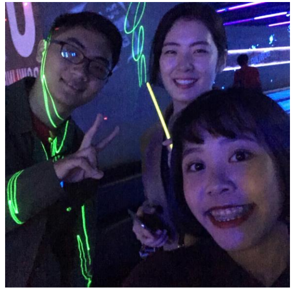
人超好的學伴姐姐