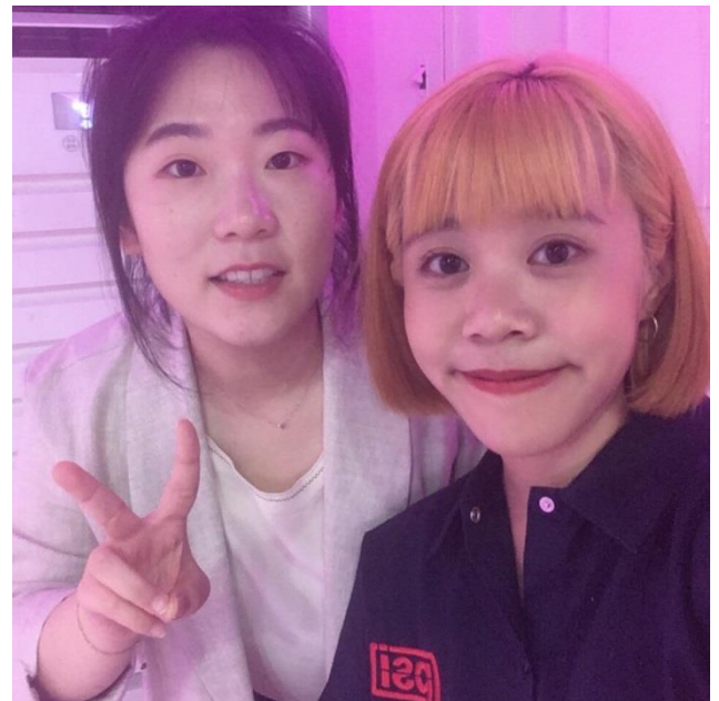
很照顧我的韓國朋友 TT