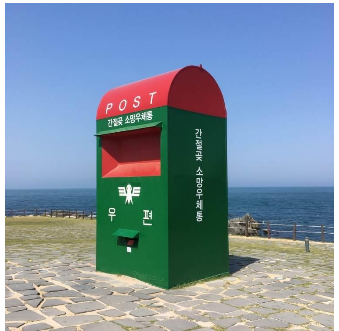
蔚山간절곶有名的大郵筒