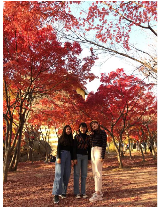
和朋友到八公山賞楓