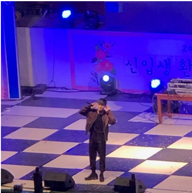
Simon Dominic 來學校表演