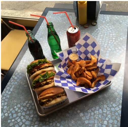
圖左是釜山西面超好吃的漢堡店 圖右是十月底的釜山國際煙火節