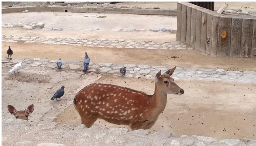
達成公園內 的小動物園