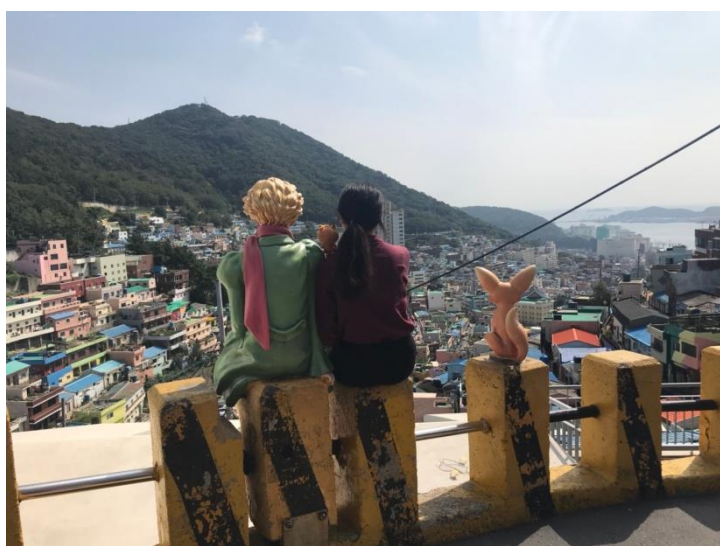
圖五、甘川洞文化村

來交換之前有來過幾次韓國，來國外讀書待的時間比較長剛好把首爾還沒走過的景點大致都走了一遍！比較知名的觀光景點幾乎都去了，除了首爾還有我們學校附近的水原之外，也去了釜山、大邱、大田等地方，本來一直很想去濟州島或是慶州跟全州，可惜後來因為時間跟金錢的關係就放棄了。不過跟來韓國玩的台灣朋友們也見了很多次面，還有我姊姊也有來韓國找我，與熟悉的人在韓國一起玩樂的時光也是充滿幸福。上學期剛來韓國的時候剛好不久後即是中秋節連假，韓國人對於中秋節的重視程度大概跟過年差不多，所以我就跟一個同學決定搭火車去釜山來個 6 天 5 夜的旅遊，釜山是韓國的第一大港口，因為靠海所以有很多新鮮的海鮮，來到海邊走在沙灘上踩著海水的感覺真的很棒！我們每天都把行程塞得很滿，有彩色房屋跟小王子的甘川洞文化村、壯觀的佛教聖地之海龍宮、一望無際的太宗台、美麗的松島天空步道及釜山各個著名的市場，像是國際市場、罐頭市場、札嘎其漁市場等，還有像西面及南浦洞這樣繁榮的逛街區，當然也少不了到釜山必吃的豬肉湯飯！神奇的是，我們在民宿認識了剛好也來釜山旅遊的台灣人，也是來韓國交換跟讀語學堂且年齡相近的朋友，後來回到首爾也都還有一起約出去吃飯，興趣相近也變成了好朋友，沒想到還有這樣美好的緣分！