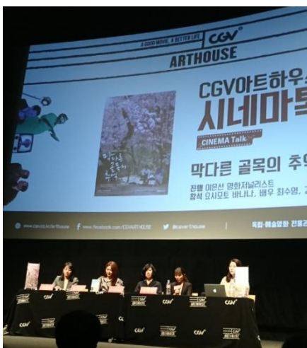
圖七、電影上映宣傳會

其實當初會想選擇來韓國交換這也是很大的原因，從小學的時候就對韓流文化產生了興趣，也一直有在自學韓文。而韓國的購物網站或是購買音源都需要有韓國的手機號碼，也需要外國人登錄證才能做很多事情，剛好來韓國交換可以讓我更有機會更近距離的跟喜歡的藝人見面。我喜歡的藝人剛好有偶像團體、樂團跟演員，所以不管是一般的演唱會、見面會、簽名會或是生日會之外，還有申請音樂節目的錄製和看藝人的上下班路，以及品牌代言活動跟電影上映宣傳會，也能觀看音樂劇及音樂節活動，去機場接送機還有頒獎典禮...等活動都能體驗到，比起在海外真的多了很多免費就可以見到喜歡的藝人的機會，想著回台灣工作後也難有這種機會了，所以更好好把握每一個可以見到真人的時刻。而其中電影上映宣傳會尤其讓我印象最為深刻，大概有分首映會、電影播放前宣傳跟電影播放後宣傳，我去的是後者，只要付一般電影票的錢，最後電影播完後，導演跟監製還有演員們會上台讓觀眾問問題，聊聊有關這部電影的拍攝過程，我覺得在電影播出之後能聽到這樣的親身解說，更能了解電影想傳達的意思，有時候切入的點跟自己的想法相同時，就非常有感，十分有趣！有時會覺得在追星的時候使用韓文的頻率，好像比一般在讀書時來的高，因喜歡的人事物也更有動力繼續努力去學習，不過我身邊的同學們都不太追星，所以通常也都只有我一個人獨自去跑各種行程，在追星的時候也認識了韓國朋友，也藉此多了可以練習韓文口語的機會。