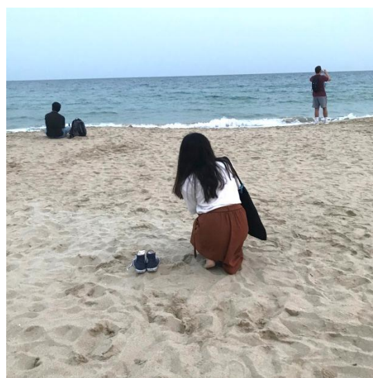
圖六、釜山的海邊-海雲台