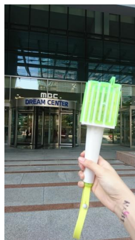
圖八、音樂節目錄製