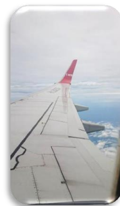
圖十一、從韓國飛回台灣的機外風景