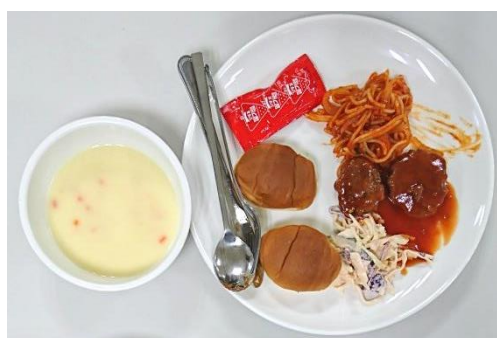
圖三、食堂西式早餐