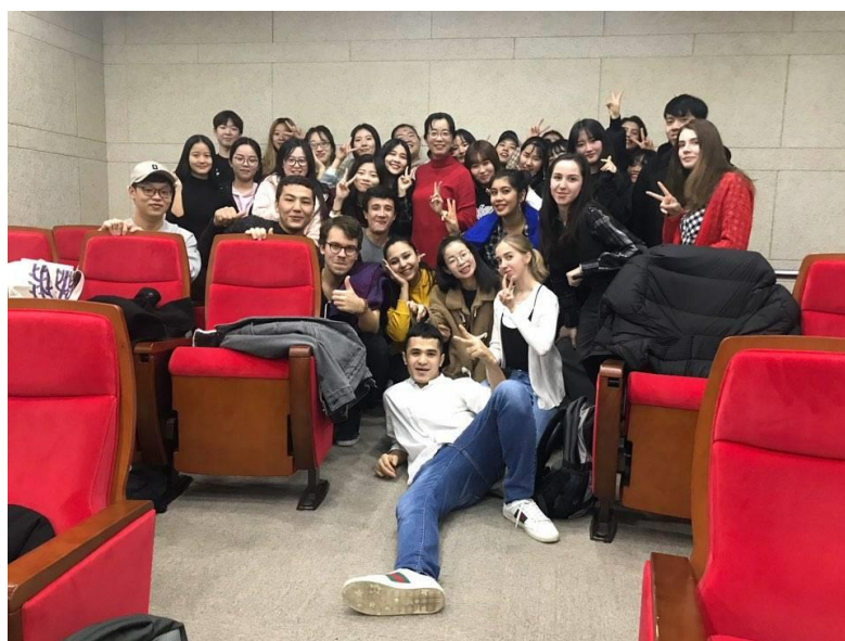
圖四、中級韓文會話期末合影

學期快開始的時候，韓信大學的國際處有集合全部的交換學生跟我們解說如何選課，學校有專門為交換學生而開的課程，我在上學期的時候選了中級韓文文法、中級韓文會話、初級英文會話還有一門傳統文化課，因為之前有在自學韓文有一點韓文基礎，選了中級的課程覺得難易度剛好，韓文老師全程都用韓文授課，也很認真教學，中級韓文會話的期末考試是讓我們分組演話劇，跟其他不同國家的交換生用韓文溝通交流並傳達角色扮演的內容，彩排的時候也笑聲不斷，拉近了彼此的距離。初級英文會話課主要環繞著地球的各种問題，因為外國老師總是喜歡大家有參與度，而我又是屬於比較被動內向的人，所以也不太敢舉手發言，稍微有點可惜了，上課的時候老師常讓我們分組分享自己對某議題的看法，最後討論出一個論點並發表給大家聽，可以藉此知道大家對生態環境的想法。