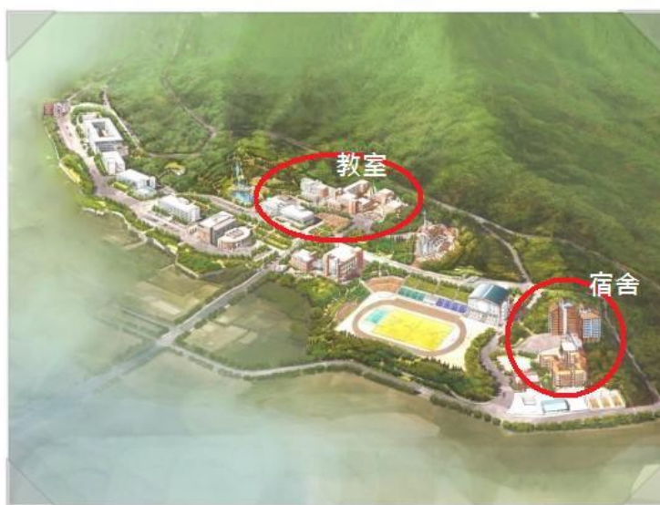
圖一、韓信大學校園示意圖

韓信大學是位於京畿道烏山市的一所基督教綜合大學，學校裡面有教堂，平常有學生會進去上課，而星期日的時候會有基督教徒們來做禮拜。韓信大學靠近山區，學校裡面有各種植物，四季都有不同的景色，春天佈滿櫻花，秋天則是銀杏金黃一片，也有小池塘跟可以散步的後山。韓信大學的校區為狹長型，我們所住的宿舍剛好是在最右邊的位置，距離到上課的教室要走大概 10 至 15 分鐘，雖然每天要爬上坡才能去上課真的是一件有點累人的事情，不過也算是個運動了！