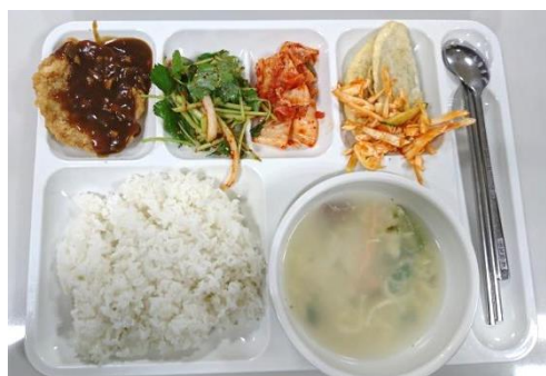
圖二、食堂一般菜色

接下來也是不可或缺的飲食部分，繳宿舍費用的時候也會包含學校食堂的食卷一起購買，一次是 80 張，一張約台幣 55 元，學期結束如果吃不完可以再退款，生活在物價比台灣高 3 倍的韓國，學校食堂真的是很好的夥伴，食堂的泡菜跟米飯都可以自己盛，其餘則是有三菜一湯，菜色可能對於有些人來說比較單調一點，還好我不是很挑嘴，只要有時間還是會去吃一下，畢竟出去外面隨便吃一餐就要台幣 120 元起跳，出門在外還是要需要經濟實惠一點的方案，韓國人一般早餐也是吃飯，我跟同學們最開心的就是有西式早餐的時候了，每次看到菜單有西式早餐就會提早起床吃完再回去睡覺。而宿舍樓下的便利商店也是我們的好朋友，如果突然吃膩食堂或是肚子餓都很方便，學校外面則是有一些餐館，雖然看起來沒有太多的選擇，不過也是算各種類型的韓國食物都有，也有 KTV 及網咖和髮廊。