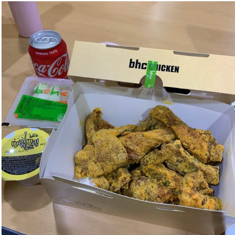
跟朋友一起在宿舍叫的外送

韓信的宿舍有分新館及舊館，我去的那時候住的是舊館，是 3 人一間的雅房，浴室跟洗手台跟大家一起共用，比起長榮大學的宿舍小，舊館沒有電梯所以行李得自己爬樓梯班上去，衣櫃也很窄，書桌沒有電燈，只有房間的大燈，如果要讀書的話，要自己買一個