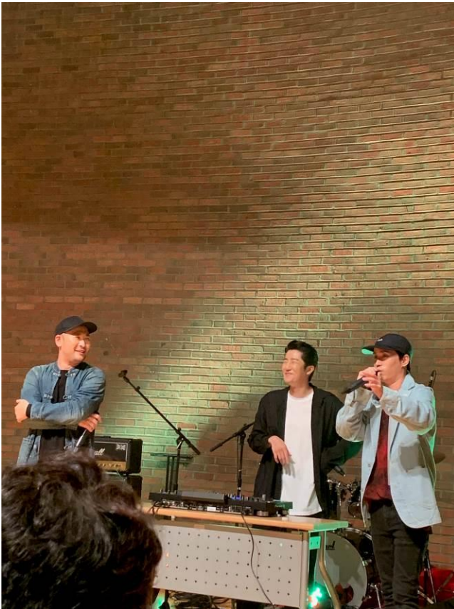
學校祭典請的 Epik High

一開始看學長姐交換心得想說會有學伴會陪伴我們，但到那邊留學生學長們說並沒有安排其實蠻失望的。因為我抵達的 9 月算是韓國學校的第二學期，所以並沒有社團博覽會那種活動能讓我們了解學校有什麼社團，我就沒有去參加了，因此我都會利用課餘時間自己跑去首爾市區玩，之後學校突然來了一位也是從台灣來的同學，來韓信讀語學堂，我才終於有人陪我一起出遊，我們也透過網路上知道在