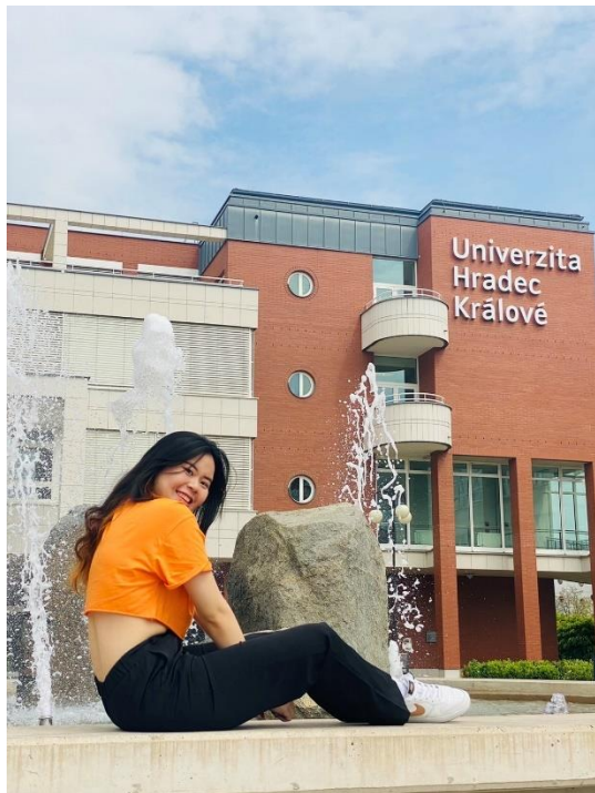
夏季學期去往克羅埃西亞為期九天八夜的海上活動體育課程(日落、捷克朋友們及大合照)