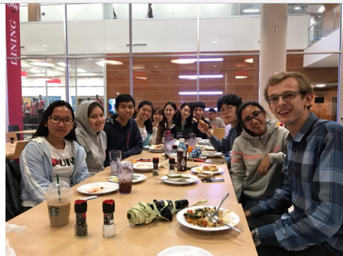
與國際生們一起在 Cafeteria 用餐