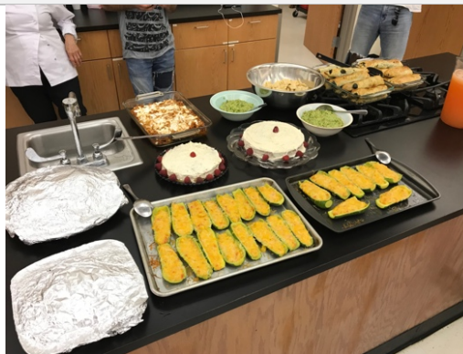
世界料理課課堂上做的墨西哥料理