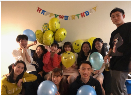
一同為壽星舉辦生日派對