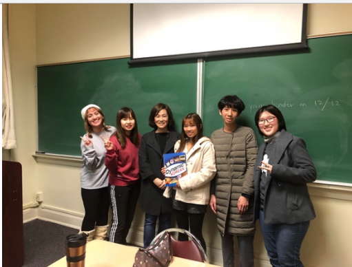
韓文課的老師及同學們