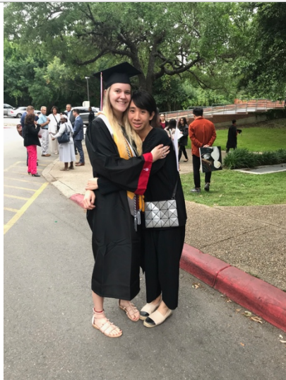
第一次參加及體驗美國的畢業典禮