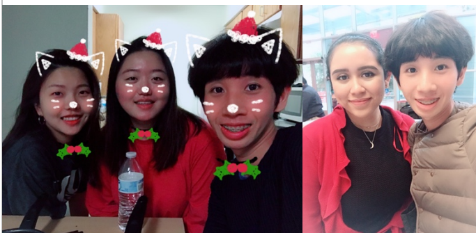
擔任中文助教時所輔導的學生們