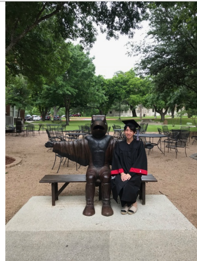
UIW 的吉祥物 Cardinal!