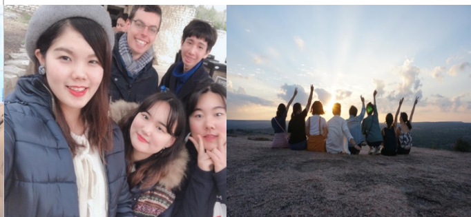
週末與來自世界各地的國際生們一同出外郊遊