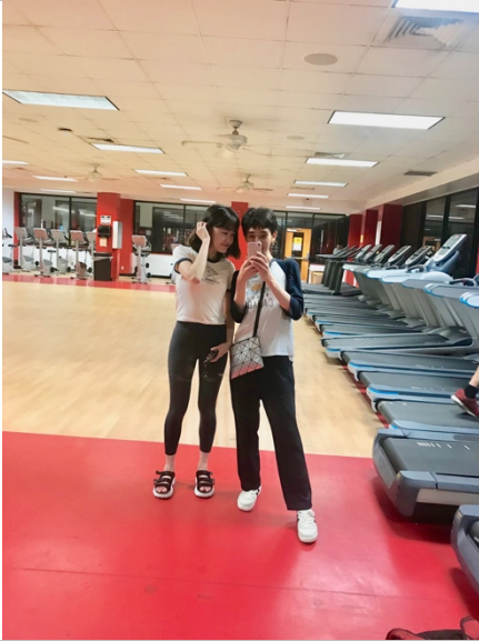
我的愛課之一 Salsa Aerobic Dance!