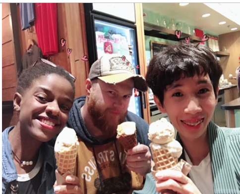
和美國朋友一起到 Pearl Farmer Market 吃甜點