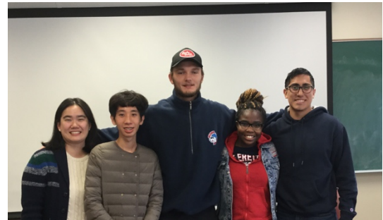
公眾演說課的組別報告- Pecha Kucha Speech