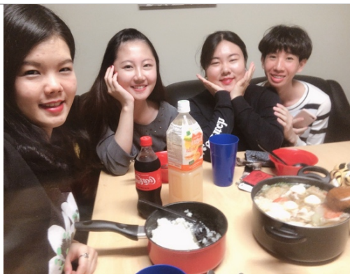
煮台式火鍋與來自日本及韓國的交換生飲食交流