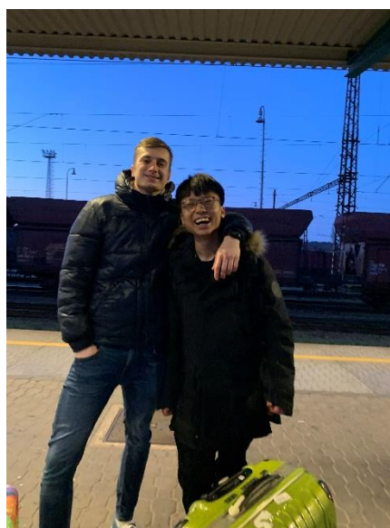
圖二十 因為疫情匆匆離開，因為友情，所以他堅持在捷克見你最後一面