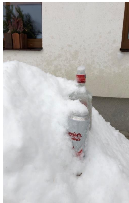
圖十六 大自然，大冰箱