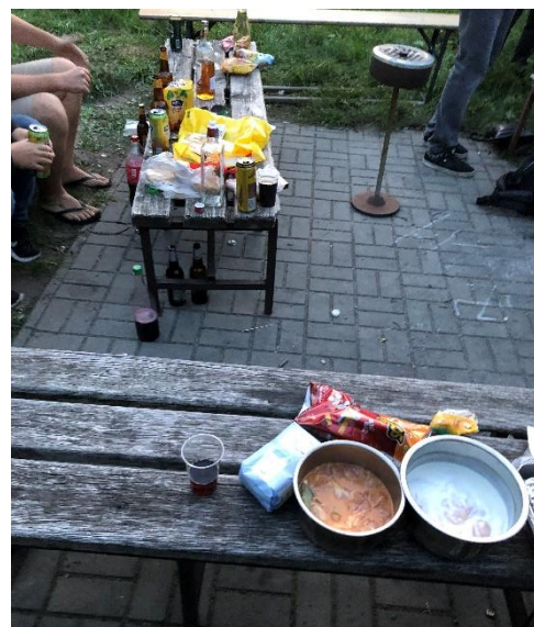
圖七 當捷克朋友邀你烤肉，卻發現只有你帶肉，他們都帶酒