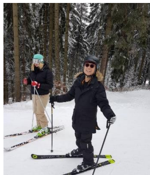
圖四 前一秒你還很興奮