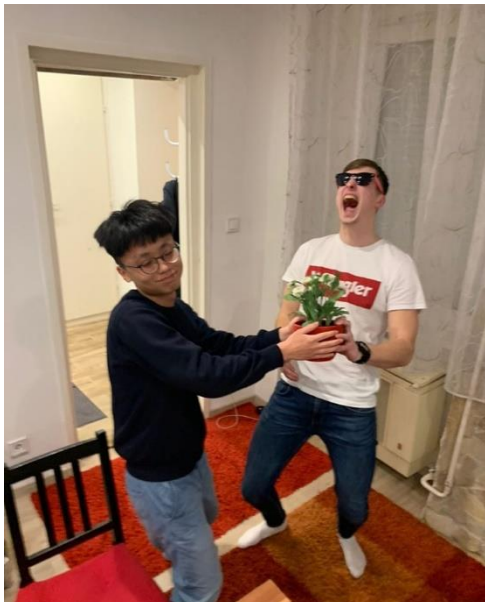
圖十五 你喝得很開心也很痛苦，所以你也回想不起來這張圖在滑稽什麼