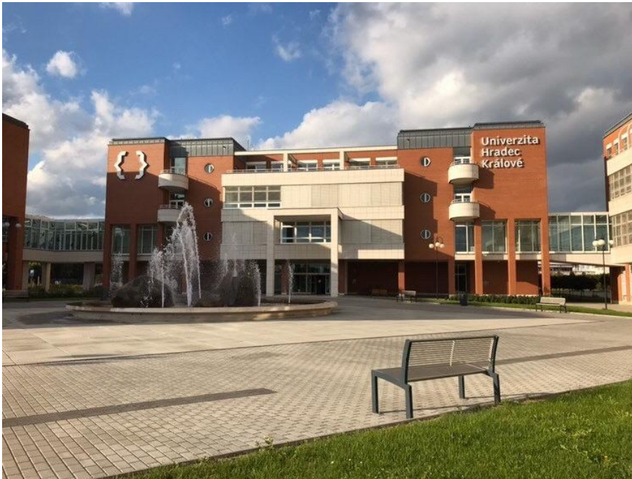
圖二 Univerzita Hradec Králové

175 克朗 3GB 流量，餐廳折價卷乙張 50 克朗，HK 城市地圖，HK 巴士交通卡申請表及教學，Welcome Party 門票、ESNcard 等。內容物可以單買，不一定要買整個禮包。