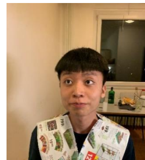
圖十 所幸安全下庄