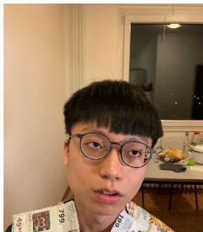
圖八 拜託朋友剪髮

Dopravní podnik města Hradce Králové（簡稱 DP HK）是 HK 小鎮內，最主要的巴士交通工具，由於 Palachova 與 UHK、Hradec Králové Hlavní Nádraží（HK 火車總站，主要聯外交通）頗有距離，在 Adalbertinum 公車站下車不遠處的 Information Center，可以申辦 City Card，申請完，等待數個工作天後，取件並選擇方案儲值卡片即可。City Card 只適用於 HK 小鎮的巴士交通，鄰近小鎮 Pardubice 亦可使用，惟計價方式不同，於 Pardubice 使用，縱使選擇月票方案，仍會被另外收費。