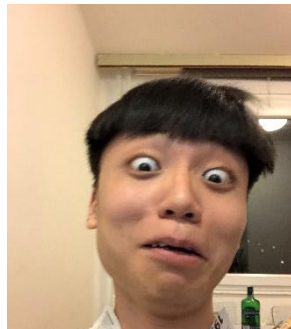
圖九 越剪越不對勁