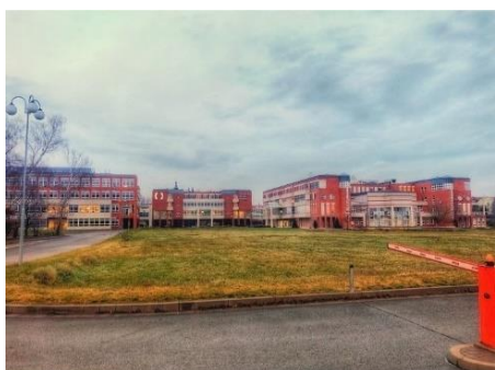
圖二十一 美麗的 UHK，致我半年來的青春