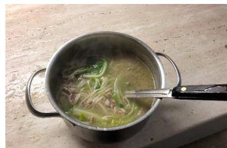
圖十四 沒有榨菜的榨菜肉絲湯麵