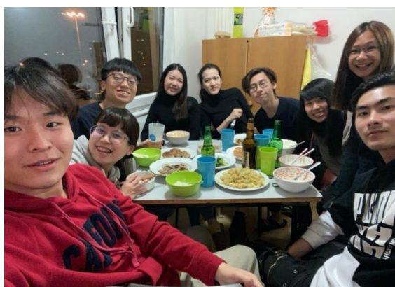
圖十九 你一定要和下學期新來的交換生分享這半年來的瘋狂