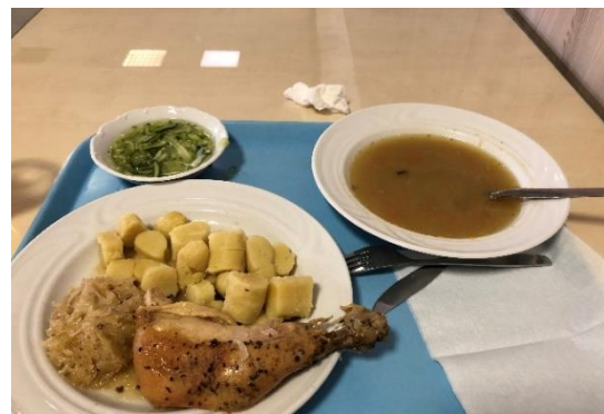
圖十二 雞腿、酸菜、捷克 Dumpling 搭配鹹湯和新鲜小黃瓜湯