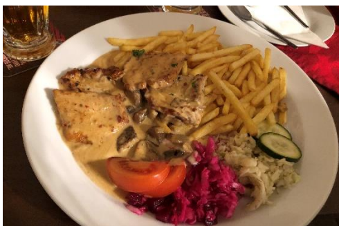
圖十三 蘑菇醬與他的快樂夥伴