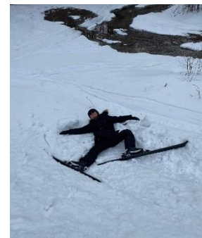
圖五 下一刻你很鬱悶