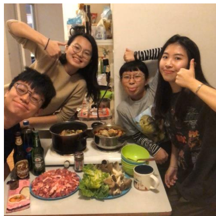
圖十八 興奮到當晚一起吃火鍋