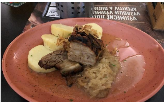
圖十一 豬肉、酸菜、捷克 Dumpling

7500 / 11048 * 100\% = 67.885\% ，伙食費用佔了我總體消費額約 7 成，我可以說我把我的獎學金都吃光了。