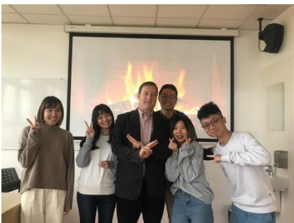
圖三 美國老師比背後這團火還要熱門

老師會要求學生作出自己國家的經濟報告，藉由大量的數據，以及課堂所學、國際時事，分析現在、過去的現象，並預測未來可能會面臨的社會狀況。Exam 則注重學生整體觀念及方向正確與否。這堂課我算是聽得頭昏腦脹，特別的專有名詞，很難一時之間反應過來。偏偏我又是課堂上唯一的台灣學生，實在沒有人可以一起討論。老師提供的經濟資訊網站，涵蓋各國，獨缺台灣，需要更費心的搜尋相關數據。