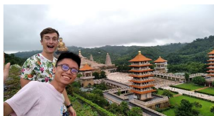
圖一 和捷克友人遊佛光山

長榮大學和 Univerzita Hradec Králové 有簽 Summer School 的短期交換計畫，為期一個月。2019 年暑假，我自願報名參加並成為捷克學生的學伴。帶領二十位捷克學生，分憂他/她們會在生活上遇到的大小事。由於學校附近的店家，英文較不流利，加上捷克的酒精文化，已經完成交換計畫的我，仍然覺得打入捷克人的生活，是非常的不容易。另外，捷克人的英文表達能力，年輕人差距頗為甚大，年長者則因經歷過政治轉變，可能會通德文或俄文，但就是不會講英文。