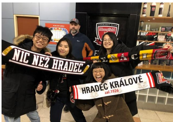
圖十七 你開始對這個地方有歸屬感，所以 HK 球隊贏了你也興奮

是微笑，在捷克人的面前，看起來就特別討喜。所以，我在捷克過的是相當快樂、逍遙，即使捷克文真的難到不行，但肢體語言，讓我們的互動，變得很有趣。我也很高興，交換結束的時候，對於捷克的印象，仍像我還未出國交換前的印象。捷克人，幽默且樂觀，講話直率且真誠，真性情也。